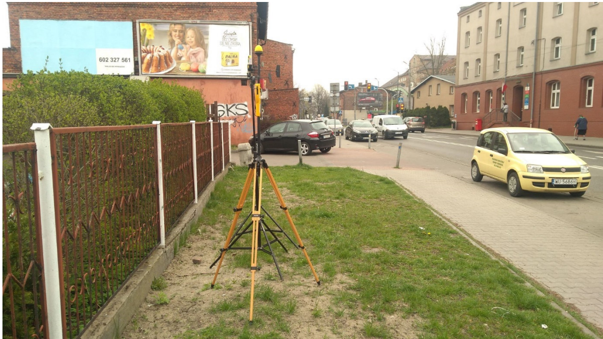
Fot. 1. Rejon badań, widok w kierunku południowo-wschodnim