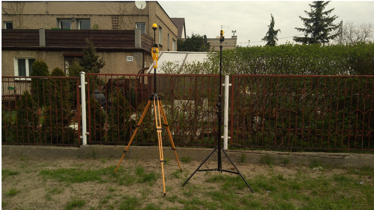
Fot. 3. Rejon badań, widok w kierunku północno-wschodnim