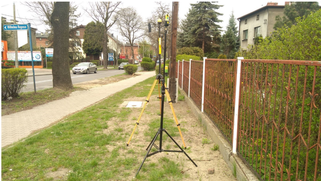
Fot. 2. Rejon badań, widok w kierunku północno-zachodnim