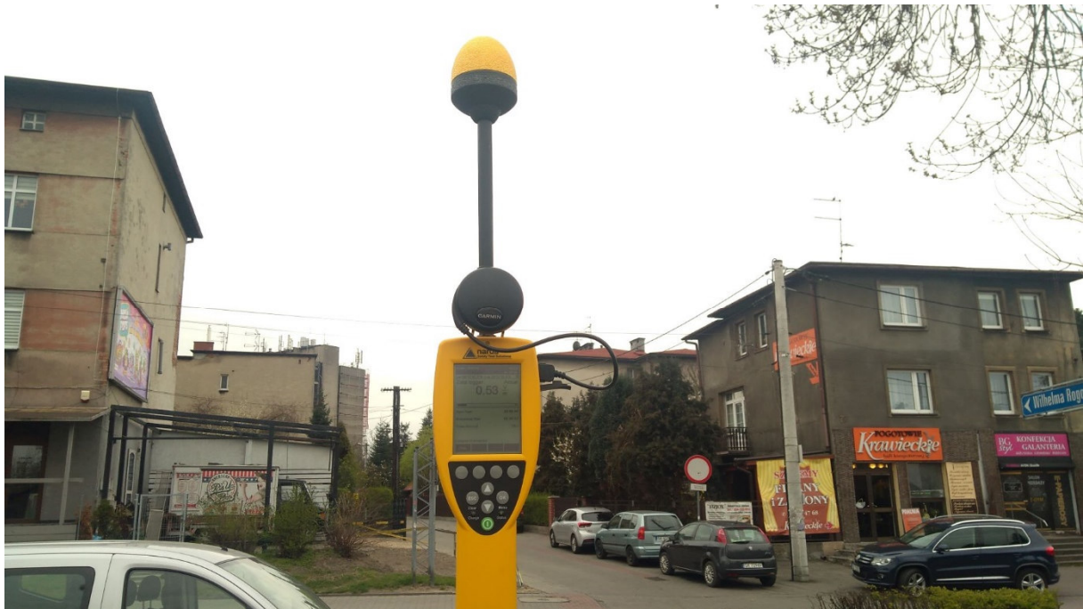
Fot. 4. Przyrząd pomiarowy w trakcie prowadzonego badania