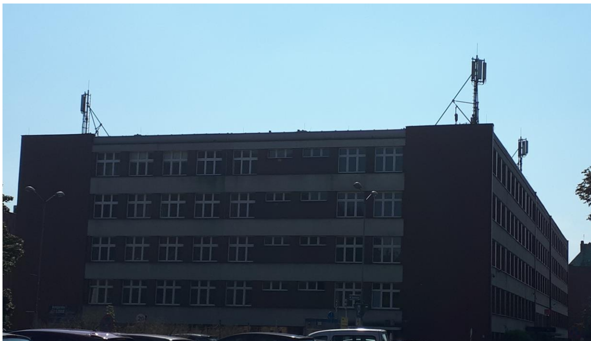
Fot. 1: Widoki anten stacji bazowej ID: 5066, zlokalizowanej: ul. Bankowa 11, Katowice