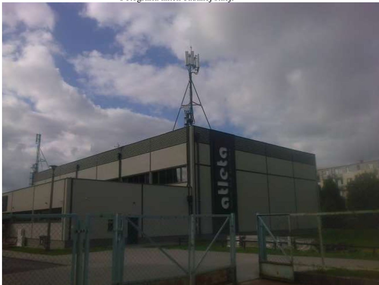
Fot. 1: Widoki anten stacji bazowej ID: GDA0012, zlokalizowanej: ul. Opolska 6, 80-395 Gdańsk