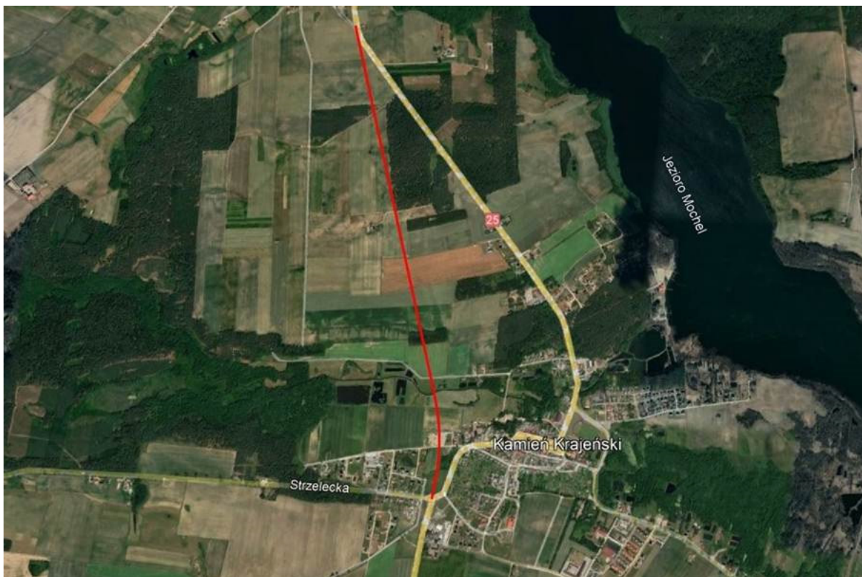
Ryc. 2 Planowany przebieg obwodnicy Kamienia Krajeńskiego