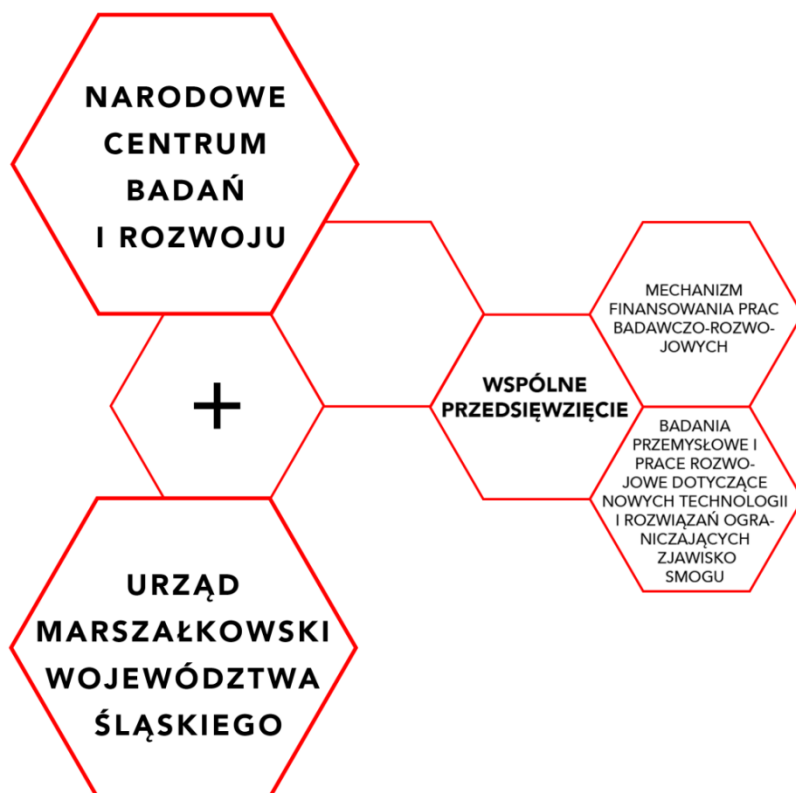
Rys. 3. Planowany mechanizm wspólnego przedsięwzięcia NCBR i Urzędu Marszałkowskiego Województwa Śląskiego.