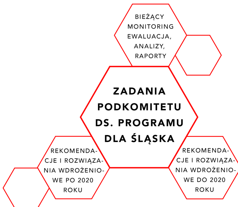
Rys. 4. Zadania Podkomitetu ds. Programu dla Śląska