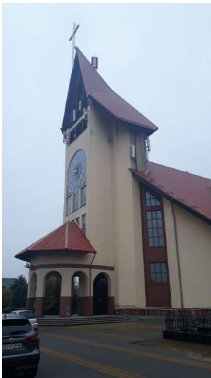
Fot. 1: Widoki anten stacji bazowych ID: 0821 oraz ID: BT44472, zlokalizowanych: ul. Żytnia 68, 10-823 Olsztyn