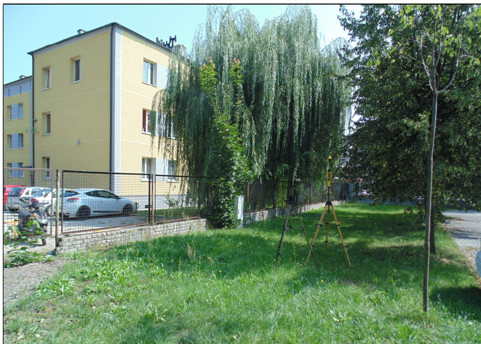
Fot.2. Rejon badań, widok w kierunku północno - wschodnim