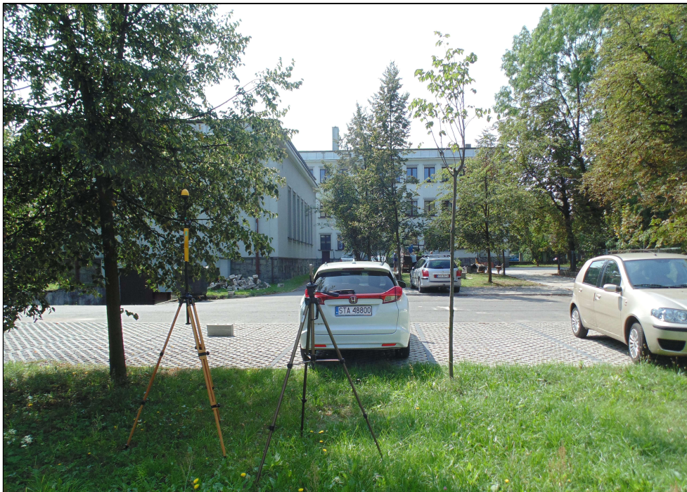
Fot.1. Rejon badań, widok w kierunku południowym - budynku Państwowej Szkoły Muzycznej I stopnia z siedzibą w Tarnowskich Górach