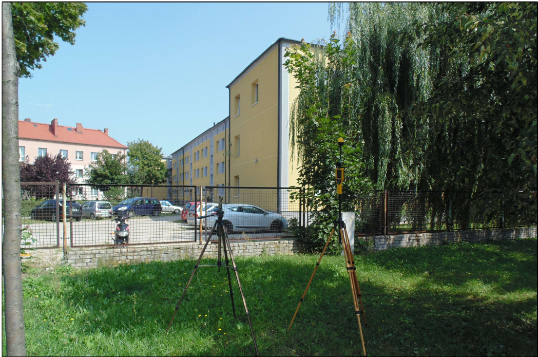
Fot.3. Rejon badań, widok w kierunku północnym