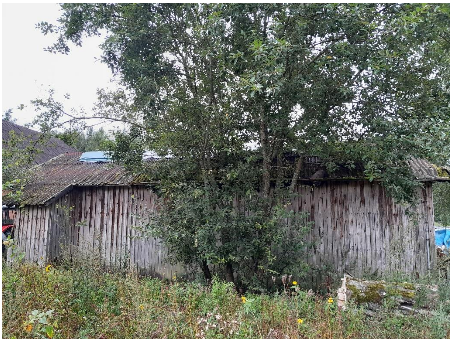
foto. 8 Budynek gospodarczy