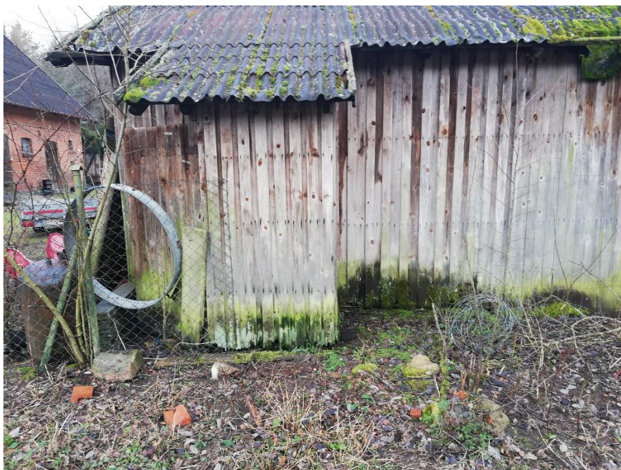
fot. 9 Budynek gospodarczy