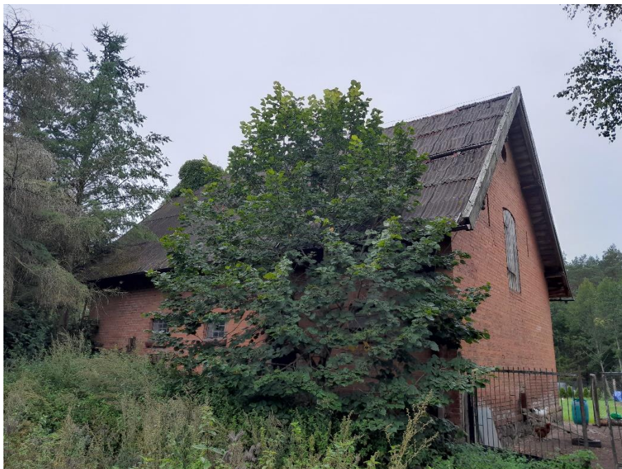
fot. 4 Budynek gospodarczy