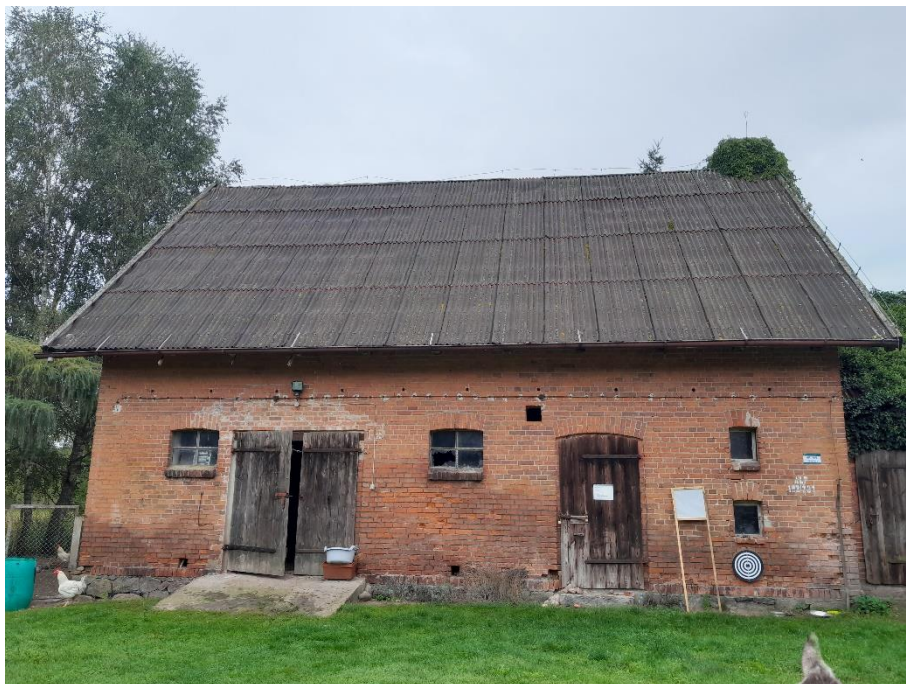
fol. 1 Budynek gospodarczy