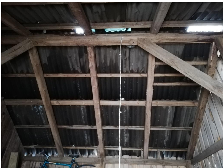
fot. 10 Widok wnętrza