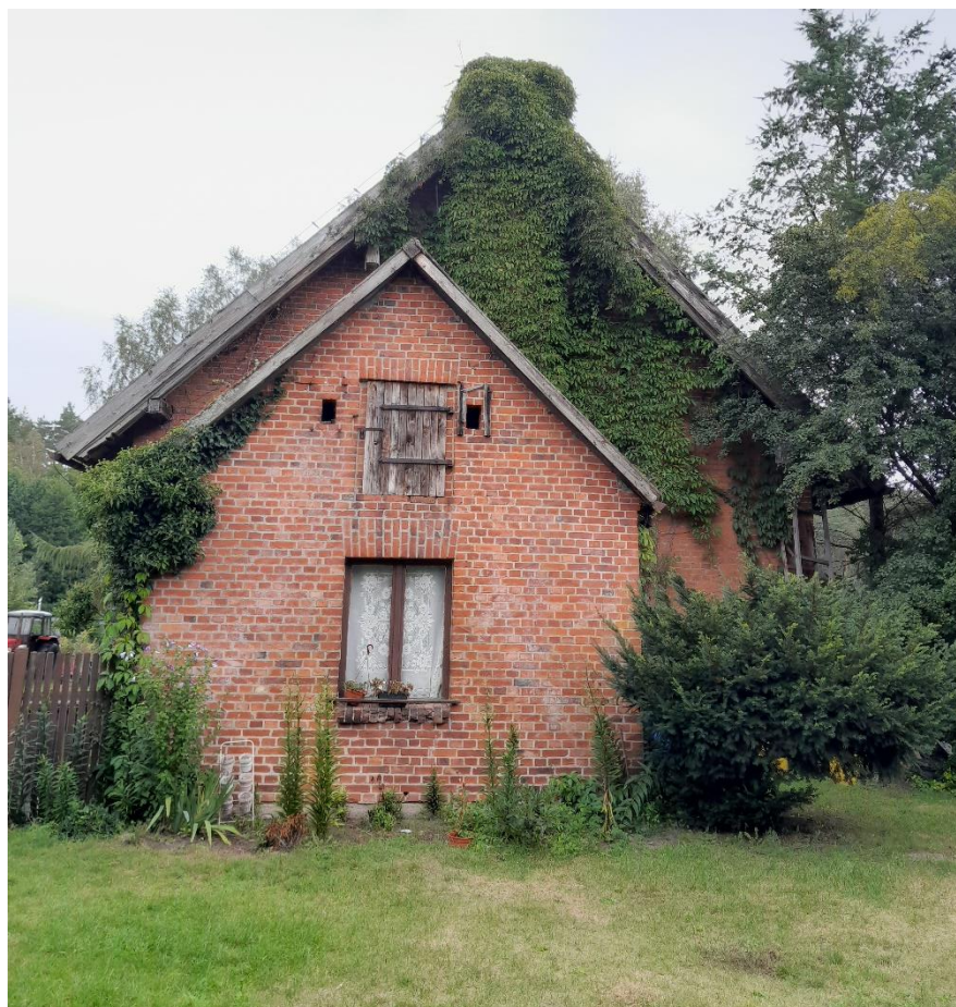
fol. 2 Budynek gospodarczy