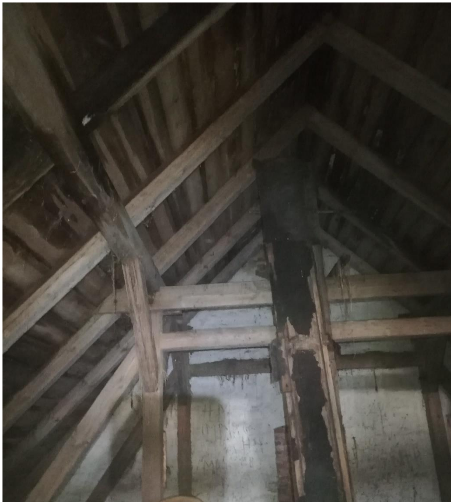
fot. 6 Widok wnętrza