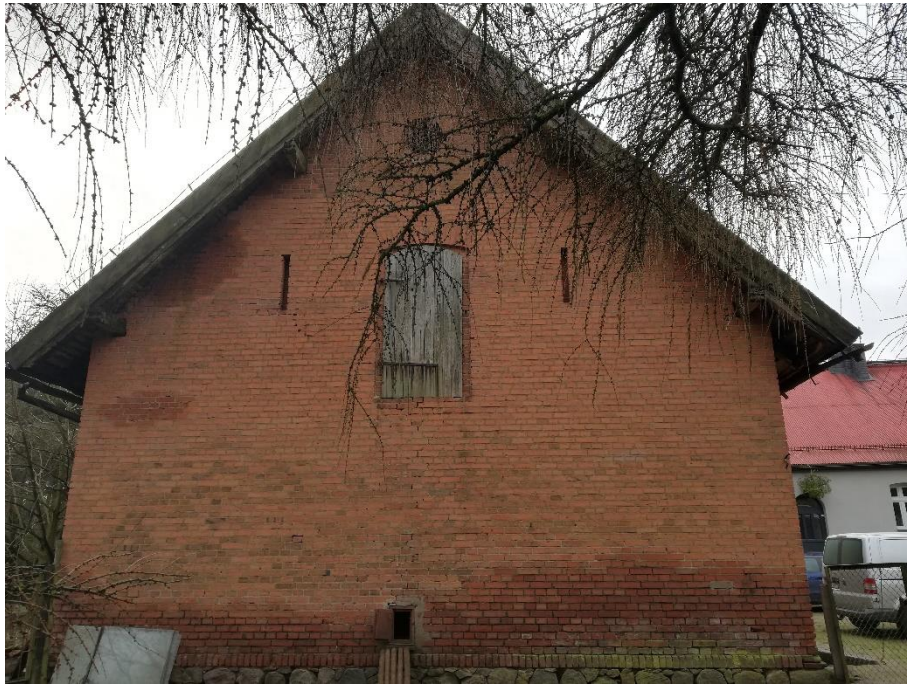
fot. 3 Budynek gospodarczy