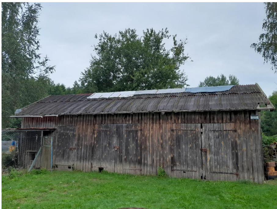
foto. 7 Budynek gospodarczy