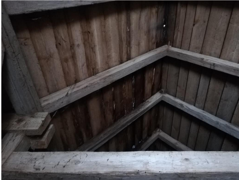
fot. 5 Widok wnętrza