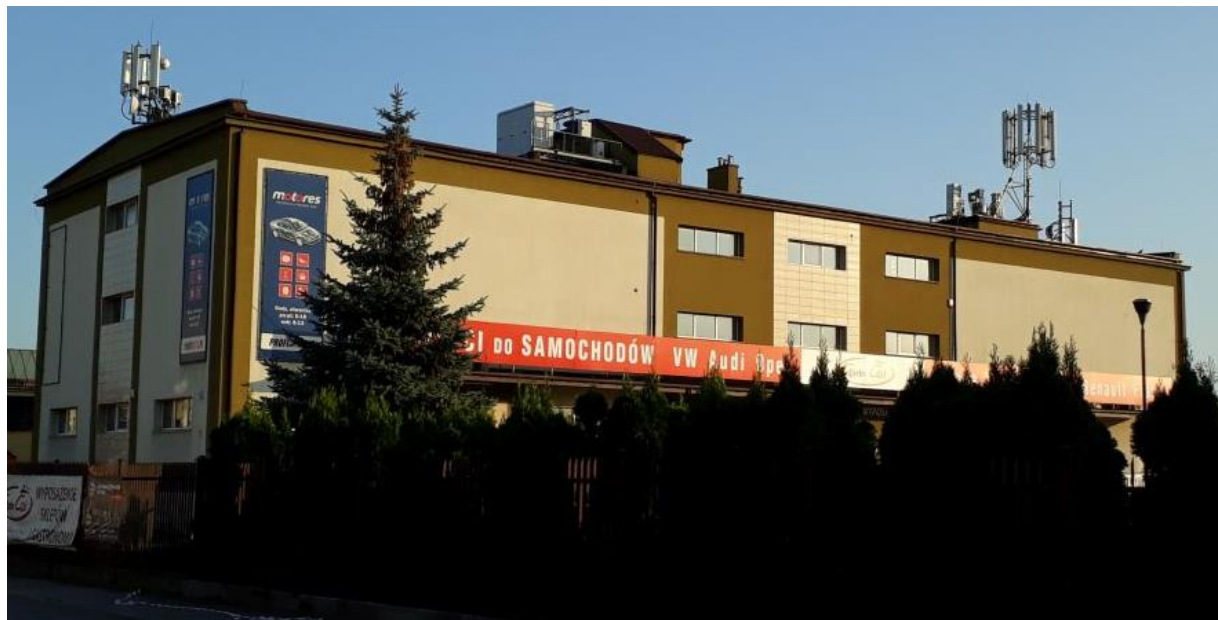
Fot. 1: Widok anten stacji bazowych: ID: RZE1016A oraz ID: BT20167, zlokalizowanych pod adresem: ul. Reja 13, 35-211 Rzeszów