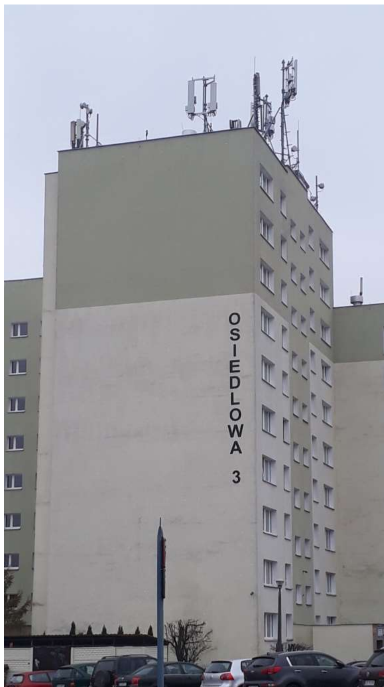
Fot. 1: Widoki anten stacji bazowych ID: 6028 oraz ID: BT44066, zlokalizowanych: ul. Osiedlowa 3, 85-794 Bydgoszcz