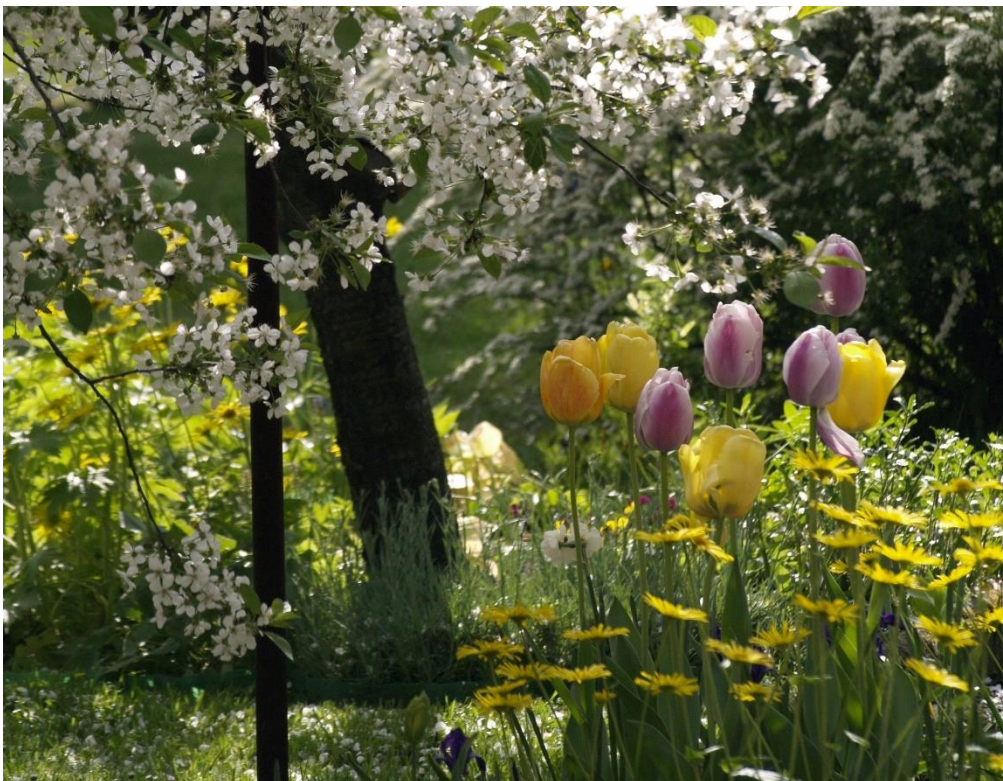
Fot. 1 Tulipany.

Ogrody wiejskie swój początek wywodzą z ogrodów przy dworach szlacheckich oraz średniowiecznych klasztorach, w których uprawiano głównie rośliny lecznicze oraz przyprawowe. Najbardziej zbliżonymi do współczesnych założeń ogrodów wiejskich były tzw. ogrody chłopskie. Początkowo ogrody wiejskie (chłopskie) miały znaczenie głównie użytkowe. Rośliny w nich uprawiane miały zastosowanie spożywcze, gospodarcze, lecznicze oraz obrzędowe. Rośliny pozyskiwane były najczęściej przez mieszkańców z pobliskich pól, łąk i lasów, np. niezapominajki, kosańce czy konwalie majowe. Zioła oraz kwiaty sadzono w formie prostych rabat przed oknem lub na grządkach.