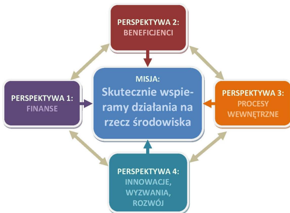
Ryc. 2: Układ czterech perspektyw strategicznych w kontekście realizacji misji

Realizacja priorytetów środowiskowych Wspólnej Strategii będzie następować w wyniku wdrażania działań zgrupowanych w ramach czterech perspektyw. Postęp w każdej z nich jest warunkiem spełnienia misji systemu Funduszy. Dodatkowo działania podejmowane w ramach poszczególnych perspektyw są ze sobą ściśle powiązane i zachodzą między nimi istotne interakcje. W każdej z perspektyw sformułowano cel, który należy rozumieć jako określenie pożądanego stanu, w kierunku którego Fundusze będą podejmować działania.