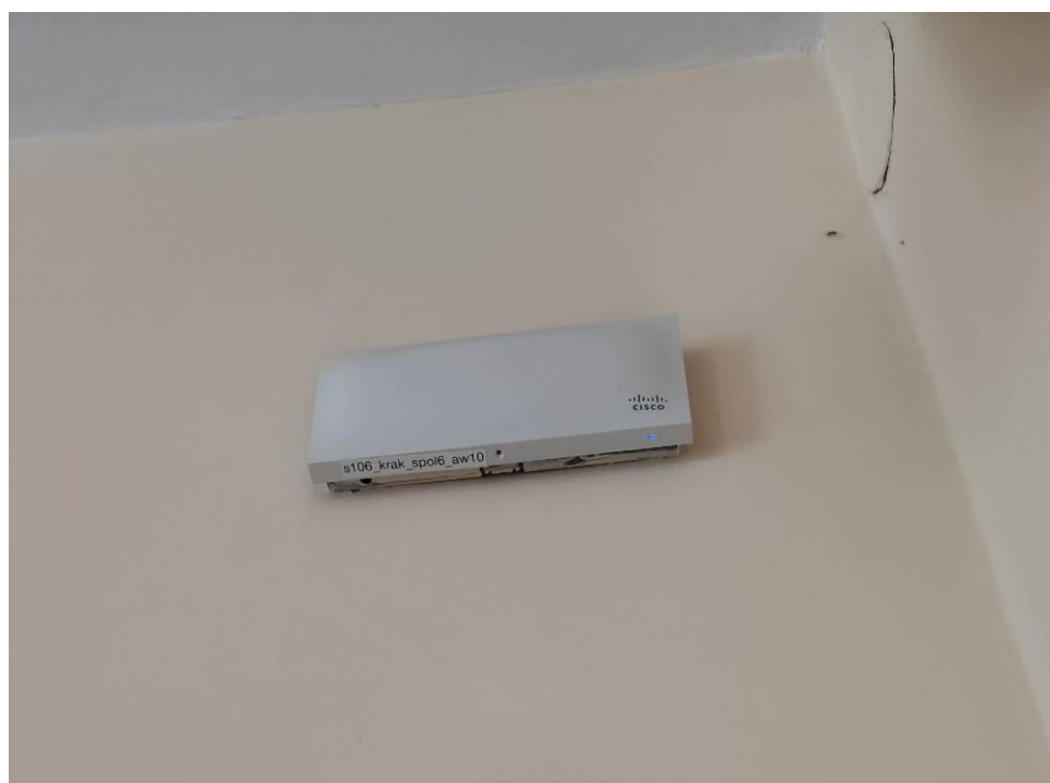
Fot. 2: Widok punktu dostępowego model MR52