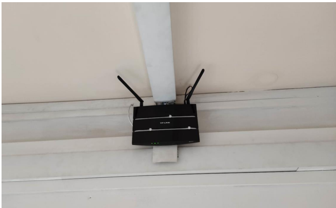
Fot. 1: Widok punktu dostępowego model TL-WDR3600