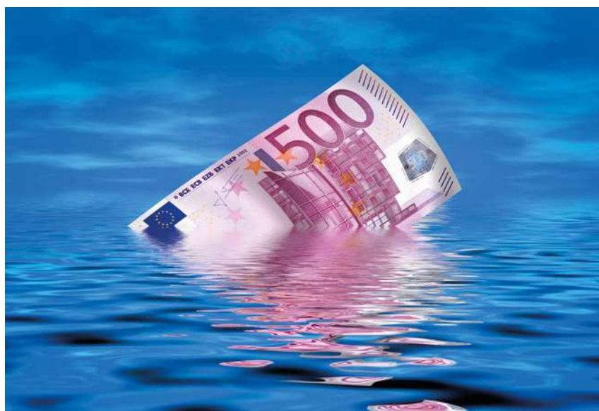
Budżet Programu Fundusze Europejskie dla Rybactwa to blisko 732 mln euro

Wnioski o dofinansowanie w programie można składać wyłącznie za pomocą systemu teleinformatycznego, w aplikacji WOD202 na formularzu udostępnionym przez ARiMR.