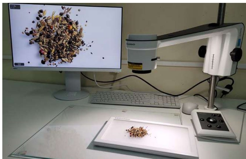
Mikroskop cyfrowy jest wykorzystywany do tworzonej cyfrowej bazy obrazów nasion

obcych gatunków, nasion porażonych, uszkodzonych, szkodników i zanieczyszczeń organicznych. Mikroskop cyfrowy ułatwia i przyspiesza ocenę siewek w testach kiełkowania oraz nasion w badaniach żywotności. Jednocześnie mikroskop cyfrowy jest wykorzystywany do tworzonej cyfrowej bazy obrazów nasion, która pozwoli na sprawną i szybkie zidentyfikowanie obiektu badań.