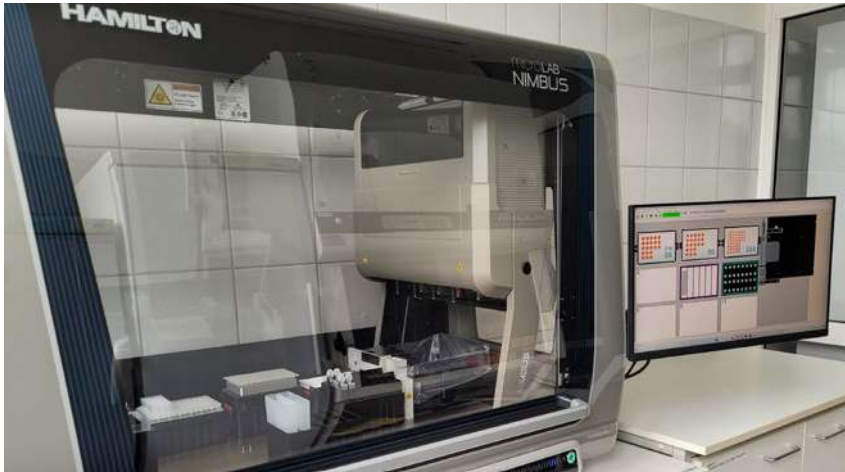
Automatyczna stacja pipetująca NIMBUS4