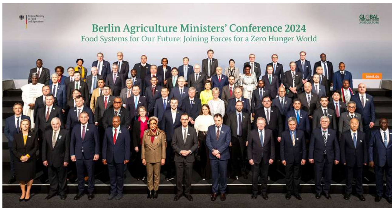
Uczestnicy Globalnego Forum Żywności i Rolnictwa w Berlinie

W czasie międzynarodowych targów Grüne Woche (Zielony Tydzień) w Berlinie – 19 stycznia 2024 r. – minister rolnictwa i rozwoju wsi Czesław Siekierski rozmawiał z ministrami ds. rolnictwa o perspektywach współpracy z Polską. Minister reprezentował Polskę także na Globalnym Forum Żywności i Rolnictwa w Berlinie, które odbyło się w trakcie Grüne Woche, 20 stycznia 2024 r. Tegoroczne hasło Forum to „Systemy żywnościowe dla naszej przyszłości: połączenie sił na rzecz wyeliminowania głodu na świecie”.