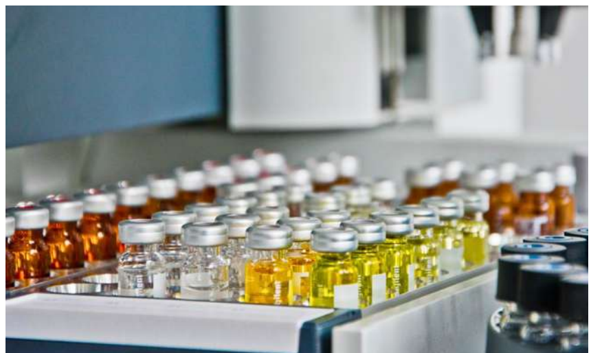
Automatyczny podajnik próbek przy chromatografii gazowej sprzężonej ze spektrometrem mas (GC-MS/MS)