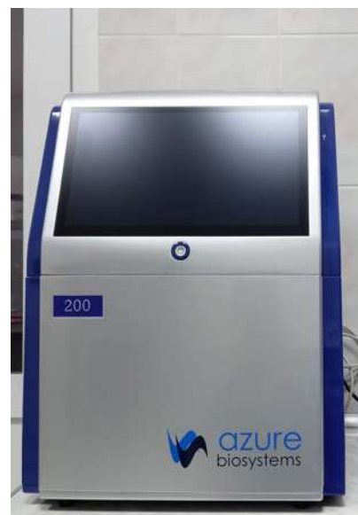
Automatyczny system dokumentacji żeli

Użycie tego sprzętu pozwala na sprawną i trafną identyfikację rodzaju zanieczyszczeń, m.in. nasion