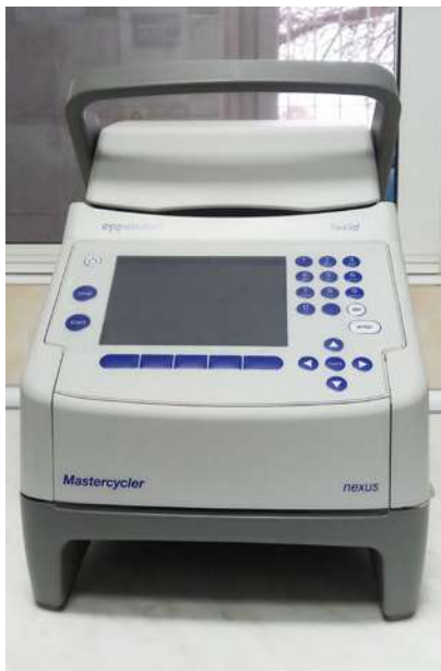
Termocykler do przeprowadzenia reakcji łańcuchowej polimerazy PCR