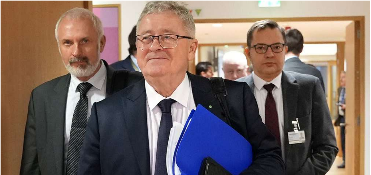
Polska delegacja podczas styczniowej Rady Agrifish w Brukseli

ochronnej, uproszczenie i przyspieszenie procedury wprowadzania środków ochronnych oraz zapewnienie możliwości wprowadzenia środków ochronnych również w przypadkach, gdy import z Ukrainy powoduje problemy jedynie w pojedynczych krajach członkowskich lub regionach UE.