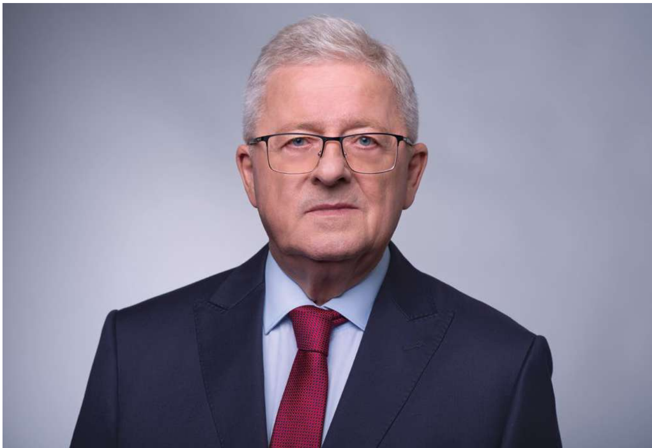
CZESŁAW SIEKIERSKI, minister rolnictwa i rozwoju wsi