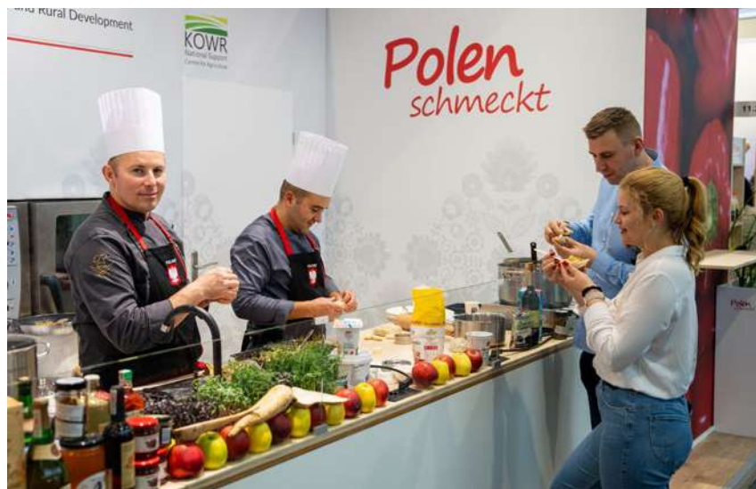
Na polskim stoisku odbywały się pokazy kulinarne i degustacje

Zielony Tydzień to również okazja do spotkań i rozmów na temat aktualnych światowych kwestii