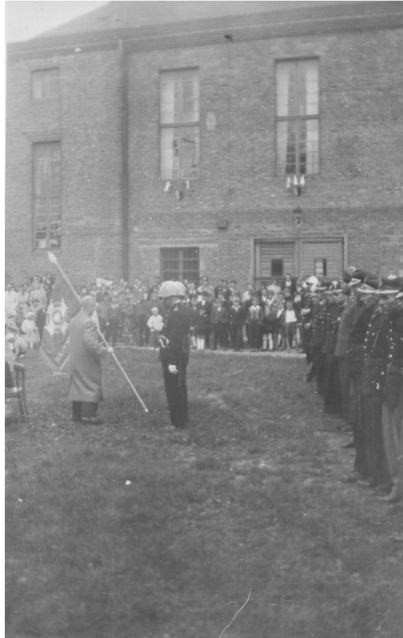
Dziedziniec placu OSP Koluszki i MZSP w Koluszkach