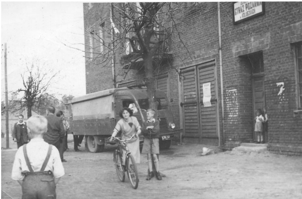
Jedynе zachowane zdjęcie frontu budynku OSP z czasów, gdy zaczynała w nim funkcjonować również Miejska Zawodowa Straż Pożarna w Koluszkach

Powołana Miejska Zawodowa Straż Pożarna rozpoczęła działalność w oparciu o sprzęt ratowniczo - gaśniczy oraz strażnicę Ochotniczej Straży Pożarnej w Koluszkach przy ul. 9 Maja 39 /obecna ul. 11 listopada 39/.