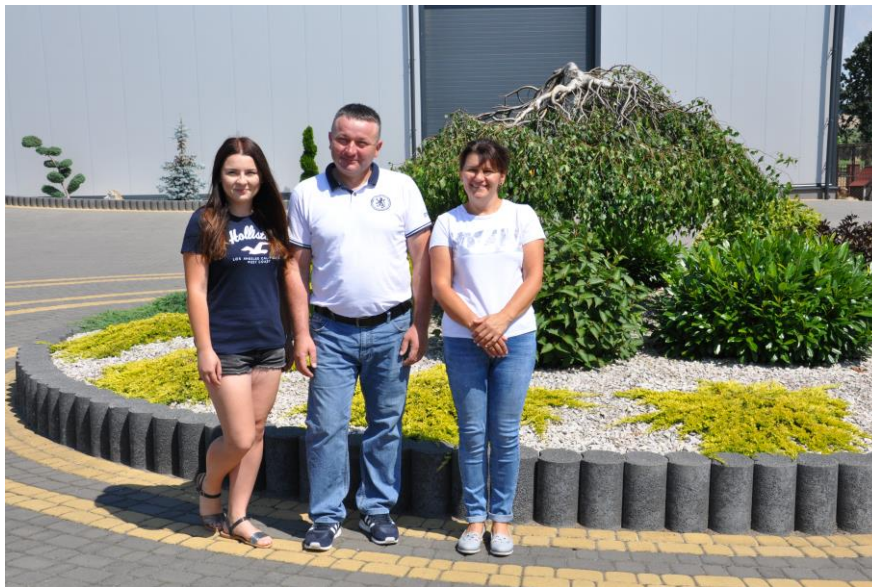
Zdobywcy I miejsca XVI edycji Konkursu Bezpieczne Gospodarstwo Rolne

Dzięki działaniom prewencyjnym organizowanym przez Kasę Rolniczego Ubezpieczenia Społecznego praca w rolnictwie staje się coraz bezpieczniejsza. Potwierdzają to dane statystyczne dotyczące liczby zdarzeń wypadkowych zgłaszanych do Kasy.