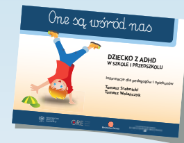
DZIECKO Z ADHD W SZKOLE I PRZEDSZKOLU