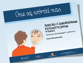
DZIECKO Z ZABURZENIAMI PSYCHOTYCZNYMI W SZKOLE