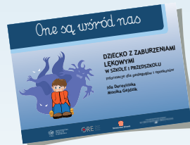
DZIECKO Z ZABURZENIAMI LĘKOWYMI W SZKOLE I PRZEDSZKOLU