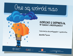
DZIECKO Z DEPRESJĄ W SZKOLE I PRZEDSZKOLU