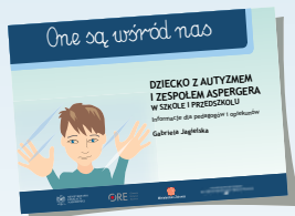
DZIECKO Z AUTYZMEM I ZESPOŁEM ASPERGERA W SZKOLE I PRZEDSZKOLU