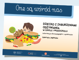
DZIECKO Z ZABURZENIAMI ODŻYWIANIA W SZKOLE I PRZEDSZKOLU