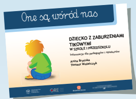
DZIECKO Z ZABURZENIAMI TIKOWYMI W SZKOLE I PRZEDSZKOLU

W drugiej serii „One są wśród nas” ukazały się: