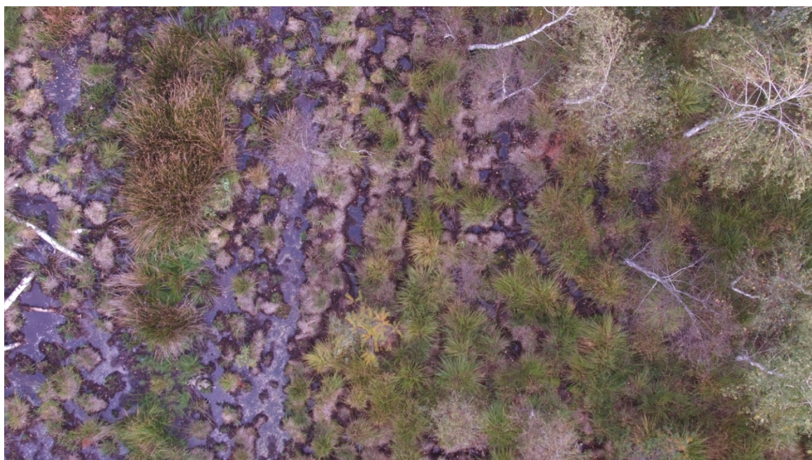
Fot. 3 Widok na powierzchnię prac