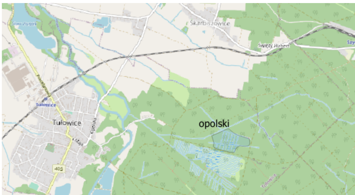
Fot. 1 Obszar prac - widok ogólny