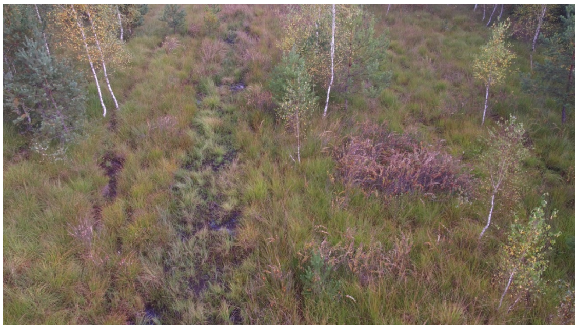
Fot. 5 Niewielkie kępy tawuły.

REGIONALNA DYREKCJA OCHRONY ŚRODOWISKA W OPOLU