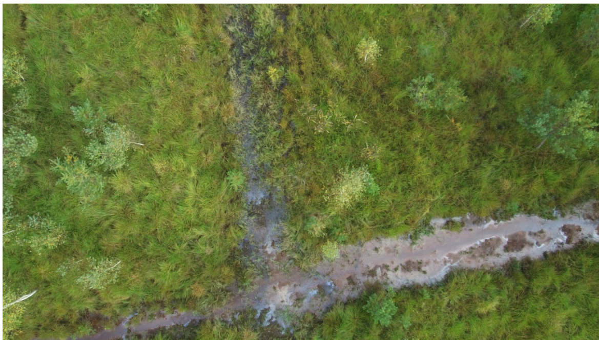
Fot. 4 Widok na powierzchnię prac