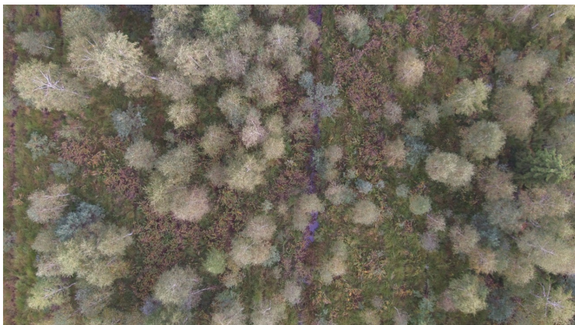
Fot. 6 Zwarte płyty tawuły w części zadrzewionej.