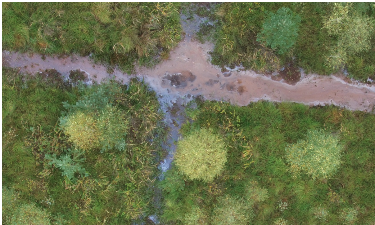
Fot. 7 Płaty tawuły przy rowach.