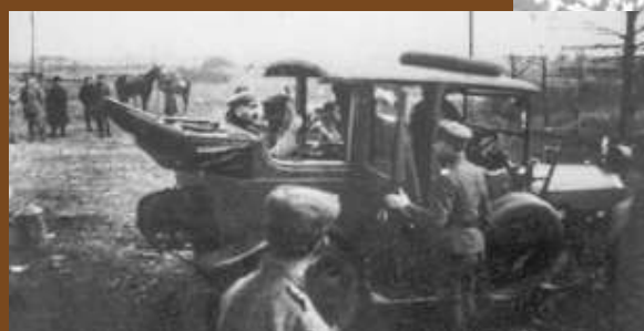
Józef Piłsudski w samochodzie, z którego dowodził kontrofensywą z nad Wieprza, 16–26 sierpnia 1920 r.