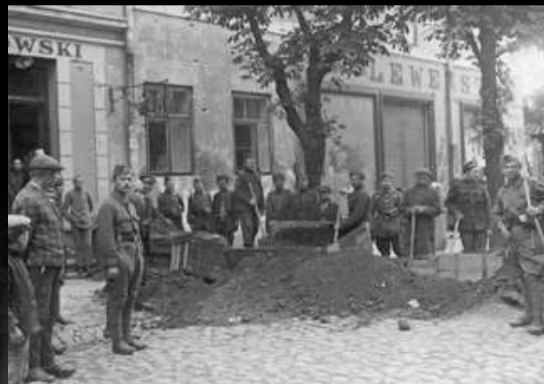
Przekopy uliczne i nasypy wzniesione przez obrońców Płocka, 18 sierpnia 1920 r.