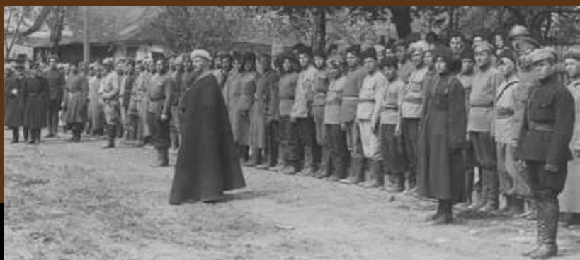
Sojusznicze wojska ukraińskie pod dowództwem atamana Symona Petlury (w głębi trzeci od lewej) po wkroczeniu oddziałów wojsk polskich do Kijowa, 10 maja 1920 r.