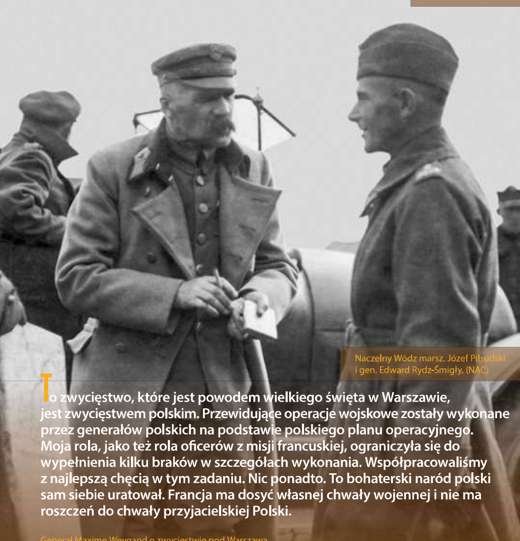
Naczelnny Wódz marsz. Józef Piłsudski i gen. Edward Rydz-Śmigły

To zwycięstwo, które jest powodem wielkiego święta w Warszawie, jest zwycięstwem polskim. Przewidujące operacje wojskowe zostały wykonane przez generałów polskich na podstawie polskiego planu operacyjnego. Moja rola, jako też rola oficerów z misji francuskiej, ograniczyła się do wypełnienia kilku braków w szczegółach wykonania. Współpracowaliśmy z najlepszą chęcią w tym zadaniu. Nic ponadto. To bohaterski naród polski sam siebie uratował. Francja ma dosyć własnej chwały wojennej i nie ma roszczeń do chwały przyjacielskiej Polski.