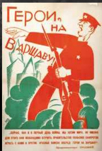
Bohaterowie, na Warszawę – plakat bolszewicki, 1920 r.

Tymczasowy Komitet Rewolucyjny Polski – „Polrewkom”, początek sierpnia 1920. W środkowym rzędzie od lewej: Iwan Skwarcow-Stiepanow, Feliks Dzierżyński, Julian Marchlewski, Feliks Kon. (domena publiczna – Polona.pl)