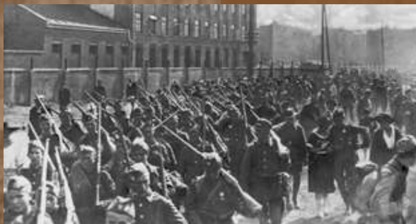
Wymarsz warszawskiej młodzieży gimnazjalnej na front. Warszawa-Praga, sierpień 1920 r.

Żołnierze Armji Ochotniczej! (...) Przyszła zatem teraz kolej na Was, którzy jako ochotnicy, wspomóżd pragniecie Armję czynną i wspólnie z nią chcecie walczyć. Powstałiście dla obrony ziem Polskich, dla obrony życia i mienia obywateli, dla obrony wolności i najświętszych ideałów Polski przed zalewem barbarzyństwa i nieubłagalnej zemsty nad naszą Ojczyzną. (...) A zatem jak powstańcy 63 roku, którzy razem z nami stoją w szeregach nosić będziecie zaszczytną kokardę powstańczą. (...) Hasło ochotnika – „w bój!” Odzew – „Na zwycięstwo!” Tak się pozdrawiać będziemy! Bóg z wami!