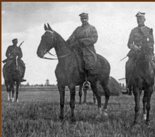
General Tadeusz Rozwadowski (szef Sztabu Generalnego Wojska Polskiego podczas Bitwy Warszawskiej w 1920 r.) w trakcie objazdu frontu pod Warszawą, sierpień 1920 r.