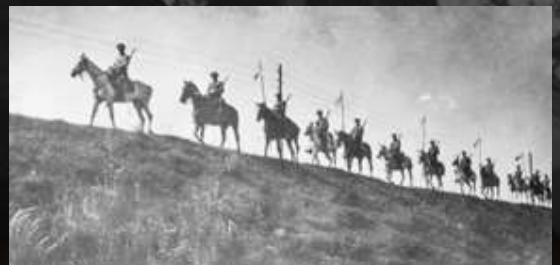
Kawaleria polska w marszu na Lidę, wrzesień 1920 r.