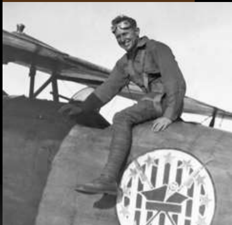
Kapitan Merian Caldwell Cooper, jeden z dowódców 7 Eskadry Myśliwskiej im. Tadeusza Kościuszki, kawaler orderu Virtuti Militari