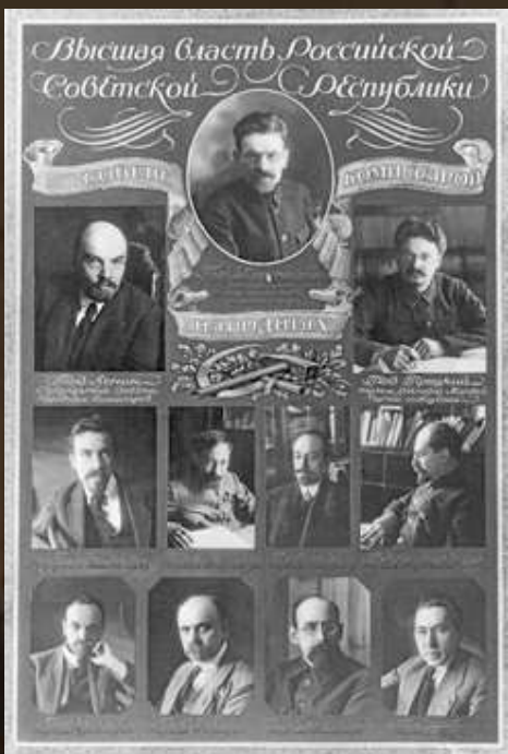
Tableau przedstawiające Radę Komisarzy Ludowych RFSRR – Sownarkom: W. Lenina, M.I. Kalinina, A. Rykova, F. Dzierżyńskiego, G. Cziczerina, A. Łunaczarskiego, N. Siemaszkę, D. Kurskiego, N. Krestinskiego, W. Szmida, 2 stycznia 1919 r.

W marcu 1917 r. w Rosji wybuchła rewolucja, w wyniku której abdykował car Mikołaj II. Rozpoczął się okres zawirowań politycznych i walki pomiędzy „białymi” (przeciwnikami komunistów) a „czerwonymi” (zwolennikami rewolucji). W kwietniu 1917 r. z Niemiec do Rosji został wysłany Włodzimierz Lenin, który wspólnie z Lwem Trockim ożywił działalność bolszewików. Siejąc zamęt i anarchizację w armii rosyjskiej, przygotowywali się do przejęcia władzy. 24 października (6 listopada) 1917 r. w Piotrogradzie wybuchł bolszewicki przewrót, który zapoczątkował 3-letni okres wojny domowej w Rosji. Zdobyć władzę przez bolszewików było korzystne dla Niemiec, z którymi 3 marca 1918 r. bolszewicy podpisali traktat pokojowy w Brześciu Litewskim. Rewolucja w Rosji była inspiracją dla wystąpień o charakterze rewolucyjnym w innych krajach, przez co stawała się zagrożeniem dla stabilności wewnętrznej niektórych europejskich państw (m.in. Niemcy i Węgry). Na drodze do światowej rewolucji „dyktatury proletariatu” stanęło niepodległe Państwo Polskie.