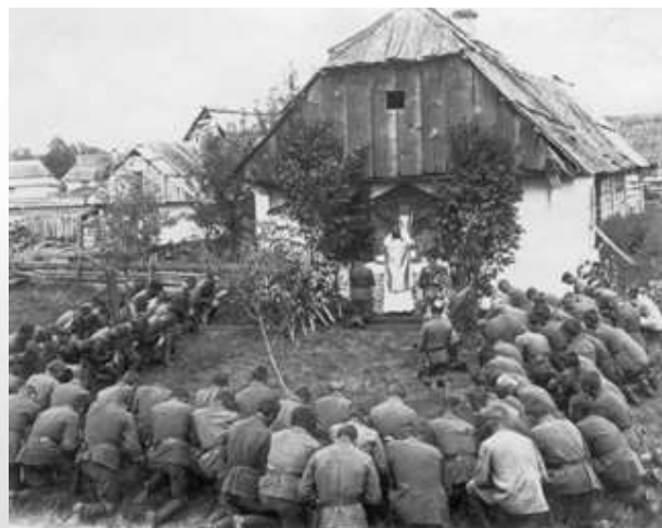
Msza polowa odprawiana przez kapelana 5 Pułku Piechoty Legionów ks. Ziółkowskiego w czasie odwrotu spod Kijowa, lipiec 1920 r.

27 maja 1920 r. skoncentrowane pod Humaniem oddziały 1 Armii Konnej dowodzone przez Siemiona Budionnego rozpoczęły atak na polskie oddziały. 5 czerwca 1920 r. „Konarmia” przełamała front pod Samhorodkiem i rozpoczęła energiczny marsz na tyły polskich jednostek. 4 lipca 1920 r. na Białorusi ruszyło główne uderzenie wojsk sowieckich Frontu Zachodniego, dowodzonego przez Michaiła Tuchaczewskiego, na polskie armie Frontu Północno-Wschodniego. Systematyczne oskrzydłujące uderzenia wojsk sowieckich na polskie pozycje spowodowały konieczność nieustannego wycofywania się polskich oddziałów z linii frontu. Armia Czerwona odrzuciła wojsko polskie na linię Bugu i Narwi, pokonując w miesiąc dystans ponad 400 km. 10 sierpnia 1920 r. linia frontu niebezpiecznie zbliżyła się do stolicy Rzeczypospolitej – osiągnęła linię Mławy, Przasnysza, Wyszkowa i Siedlec.