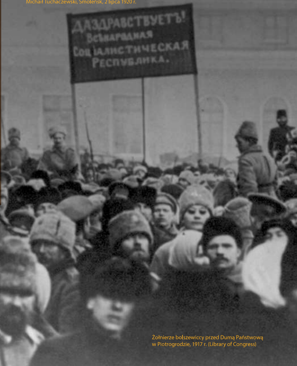
Żołnierze bolszewicy przed Dumą Państwową w Piotrogradzie, 1917 r.

Michaił Tuchaczewski, Smoleńsk, 2 lipca 1920 r.