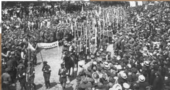
Oddział kosynierów Stowarzyszenia Robotników Niezależnych defiluje przed gen. Józefem Hallerem w dniu święta Armii Ochotniczej. Warszawa, 18 lipca 1920 r.

3 lipca 1920 r. Rada Obrony Państwa podjęła decyzję o utworzeniu Armii Ochotniczej dowodzonej przez gen. Józefa Hallera i wezwała polskich obywateli, aby do niej wstępowali. W Bitwie Warszawskiej i kontr ofensywie znad Wisły, Wkry i Wieprza wzięli udział m.in. uczniowie, studenci, korporanci, Ochotnicza Legia Kobiet, robotnicy, ochotnicze formacje policji państwowej, Straż Obywatelska. W sumie ponad 100 tys. żołnierzy.