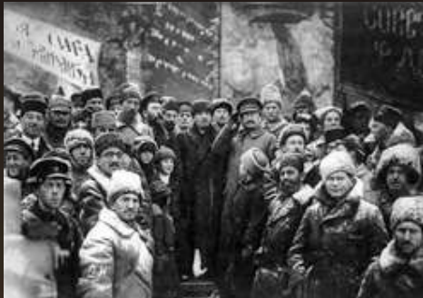
Przywódcy sowieccy (pośrodku Włodzimierz Lenin i Lew Trocki) świętują drugą rocznicę rewolucji październikowej, Moskwa, plac Czerwony, 7 listopada 1919 r.