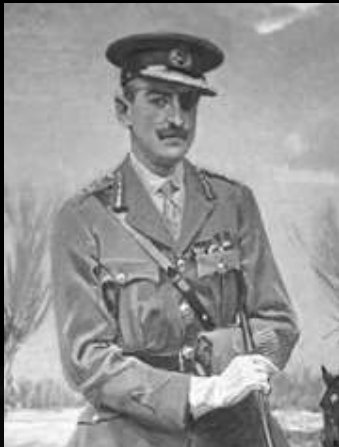
Reprodukcja portretu płk. Adriana Carton de Wiarta (1880–1963), namalowanego przez Wojciecha Kossaka (domena publiczna)

B itwa pod Warszawą została nazwana Cudem nad Wisłą i trzeba powiedzieć, że nigdy cud nie zdarzył się w odpowiedniejszej chwili, bowiem gra toczyła się o ogromną stawkę. Gdyby Warszawa upadła, Polska, a także większa część Niemiec i Czechosłowacja stałyby się krajami komunistycznymi.