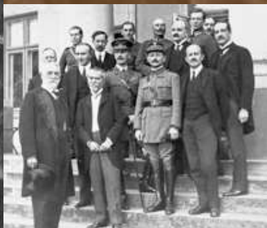
Członkowie Misji Międzysojuszniczej do Polski, sierpień 1920. W pierwszym rzędzie od lewej: lord Edgar Vincent D'Abernon, Jean Jules Jusserand, gen. Maxime Weygand, Maurice Hankey (domena publiczna)

kpt. Merian Caldwell Cooper jeden z dowódców 7 Eskadry Myśliwskiej im. Tadeusza Kościuszki, składającej się m.in. z amerykańskich pilotów ochotników.