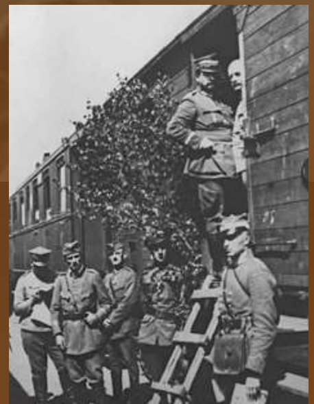
General Józef Haller, Generalny Inspektor Armii Ochotniczej w 1920 r., dowódca Frontu Północnego, przewodniczący Obywatelskiego Komitetu Wykonawczego Obrony Państwa (w pociągu z lewej strony) w otoczeniu sztabu

Pod wpływem niepowodzenia w walce z nacierającymi oddziałami bolszewickimi Michaiła Tuchaczewskiego Wódz Naczelny marszałek Józef Piłsudski wprowadził zmiany w dowodzeniu. 22 lipca 1920 r. powołał na Szefa Sztabu Generalnego Wojska Polskiego gen. Tadeusza Rozwadowskiego. Dowódcą Frontu Północno-Zachodniego został gen. Józef Haller. Doradcą Naczelnego Dowództwa został francuski generał Maxime Weygand. W Bitwie Warszawskiej dowodzili również: gen. Władysław Sikorski – 5 Armią (osłona Warszawy z północnego zachodu), gen. Władysław Latinik – 1 Armią (obrona linii przedpoła Warszawy) oraz gen. Bolesław Roja – 2 Armią (obrona linii Wisły od Warszawy do Dębłina). Frontem Środkowym – 3 i 4 Armią – dowodził gen. Edward Rydz-Śmigły. Dowództwo kontruderzenia grupy manewrowej znad Wieprza przypadło w udziale Naczelnemu Wodzowi marsz. Józefowi Piłsudskiemu i gen. Edwardowi Rydzowi-Śmigłemu. Frontem południowym dowodził gen. Waław Iwaszkiewicz-Rudoszański.