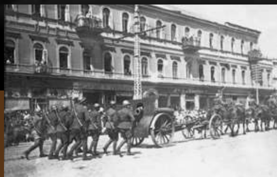
Defilada artylerii polskiej w Kijowie, 9 maja 1920 r. (CAW WBH)