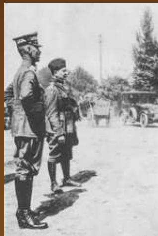
General Władysław Sikorski, dowódca 5 Armii oraz literat Juliusz Kaden-Bandrowski obserwują przemarsz dywizji ochotniczej w Nasielsku, 19 sierpnia 1920 r.