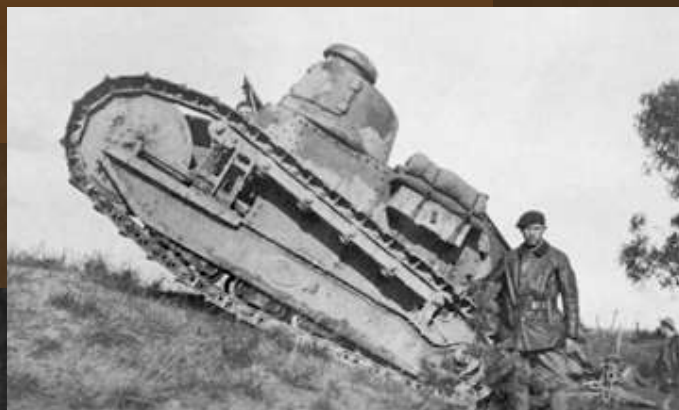
Czołg francuskiej produkcji Renault FT-17 z 1 Pułku Czołgów pod Dyneburgiem, 1919 r.

Wiosną i latem 1919 r. gen. Stanisław Szeptycki, dowódca Frontu Litewsko-Białoruskiego, dowodził walką z bolszewikami na wschodzie. 9 sierpnia zajął Mińsk, 29 sierpnia Bobrujsk, 11 września Borysów, 22 września Połock. W październiku i listopadzie 1919 r. trwały negocjacje pokojowe, które przerwano w grudniu 1919 r. wskutek sukcesów armii bolszewickiej w walce z białą armią gen. Antona Denikina. 30 grudnia 1919 r. zawarto sojusz wojskowy między Polską a Republiką Łotewską. Wojsko polskie wsparło Łotyszy w walce z bolszewikami w czasie tzw. operacji Zima. 3 stycznia 1920 r. armia polska gen. Rydza-Śmigłego przy wsparciu sił łotewskich oswobodziła Dyneburg, a następnie usunęła siły bolszewickie z Łatgalii.