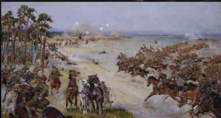
Obraz Bitwa pod Komarowem Jerzego Kossaka. W bitwie stoczonej 31 sierpnia 1920 r. polska kawaleria pokonała 1 Armie Konną Siemiona Budionnego (Muzeum Wojska Polskiego)

Podpisywanie traktatu preliminarnego między Polską, Rosją Sowiecką i Ukraińską SRR w pałacu Czarnogłowców w Rydze, 12 października 1920 r. (CAW WBH)