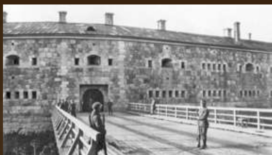
Polska załoga twierdzy Dyneburg, 1920 r. (CAW WBH)

Wojsko polskie na Łotwie podczas tzw. operacji Zima, styczeń 1920 r. (CAW WBH)