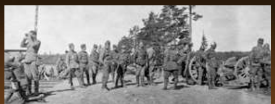
Major Wincenty Kowalski (drugi z lewej), dowódca II batalionu 5 Pułku Piechoty Legionów, obserwuje przebieg bitwy pod Lidą. Widoczni również żołnierze 1 pułku artylerii połowej oraz 5 Pułku Piechoty Legionów, 28 września 1920 r.