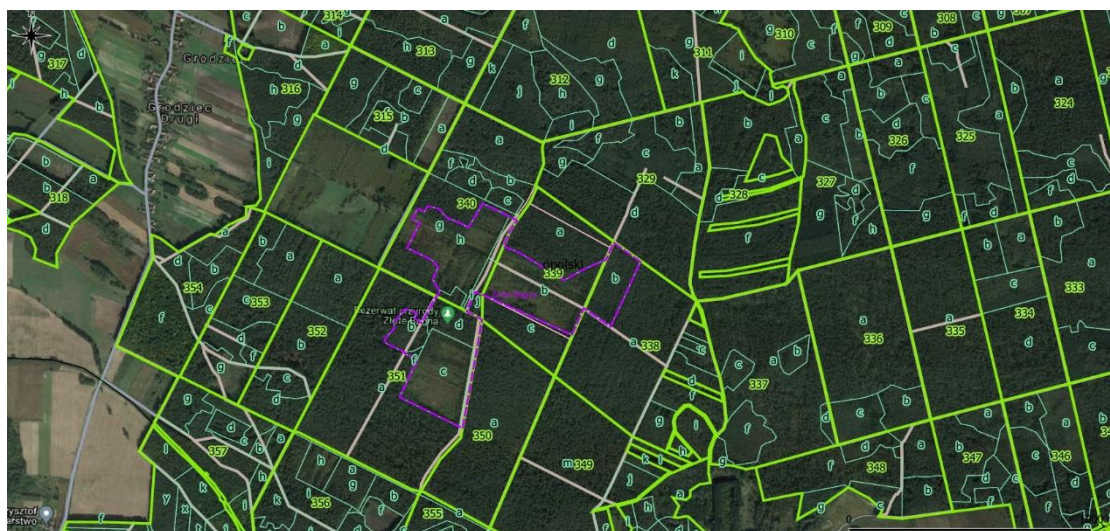
Mapa 2. Obszar objęty pracami – widok szczegółowy, z uwzględnieniem wydziałów leśnych oraz dróg gruntowych.