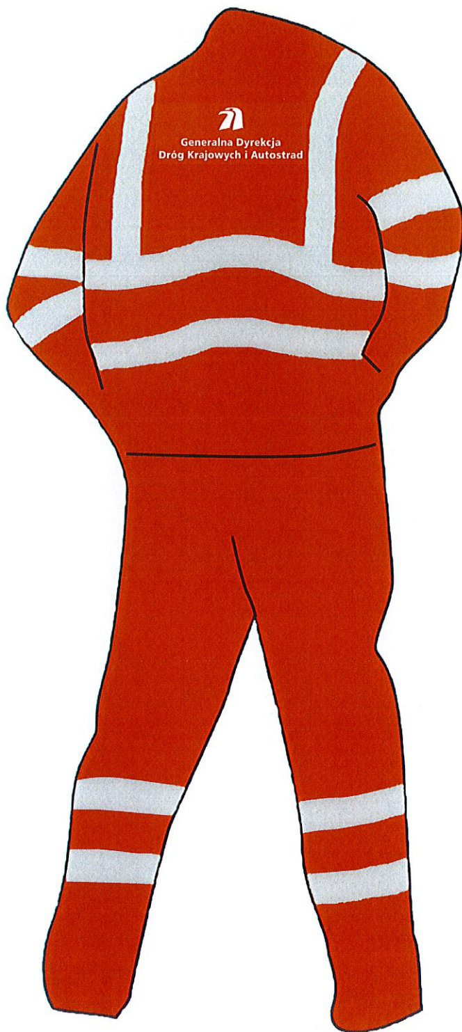
ubranie 2-częściowe letnie, zimowe - tył