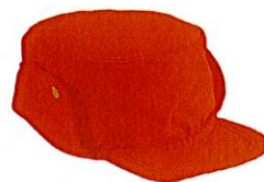
czapka letnia i zimowa