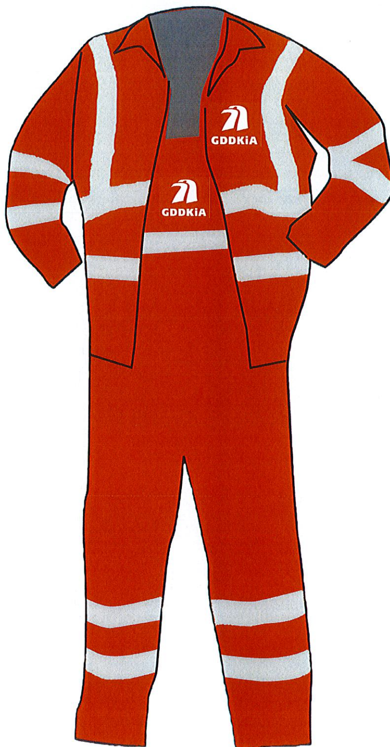
ubranie 2-częściowe letnie, zimowe - przód