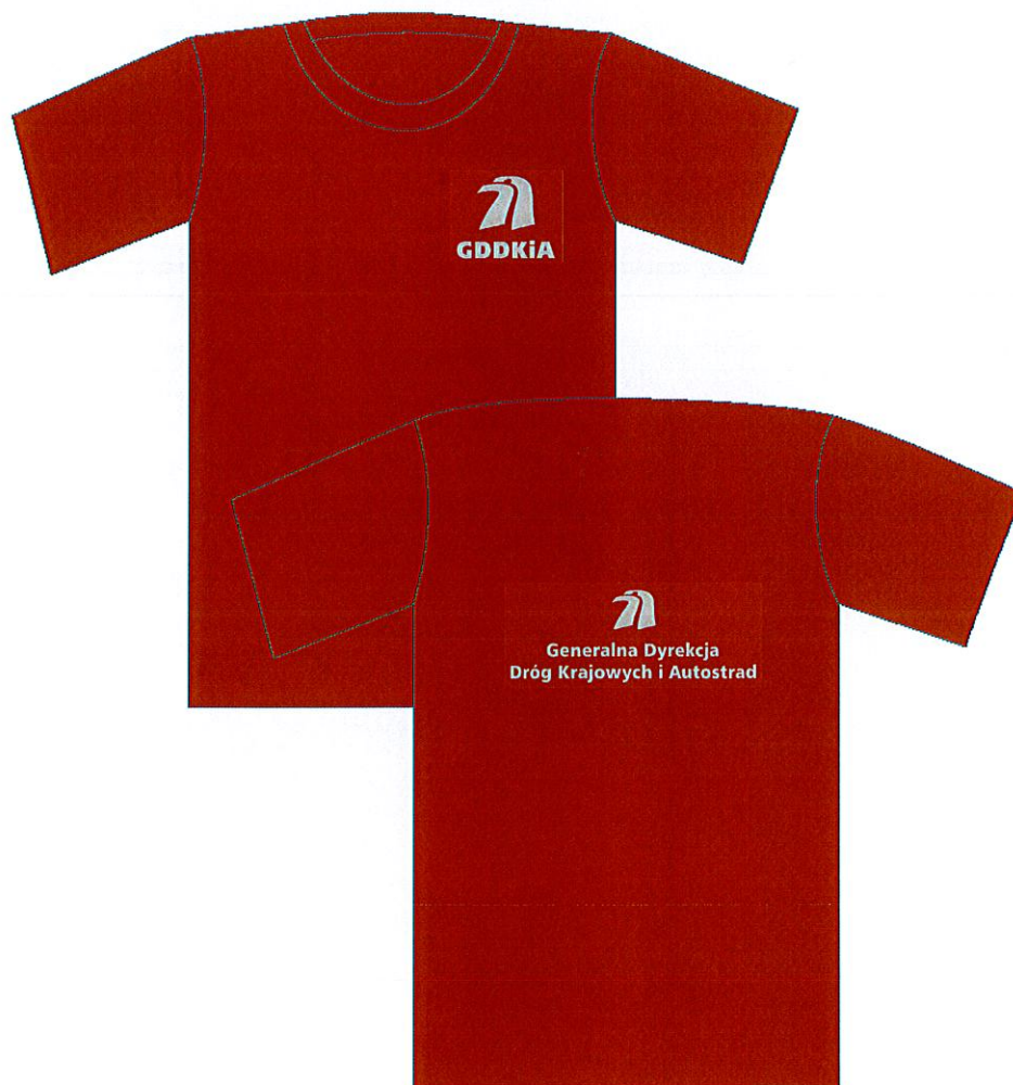
koszulka z krótkim rękawem - przód i tył