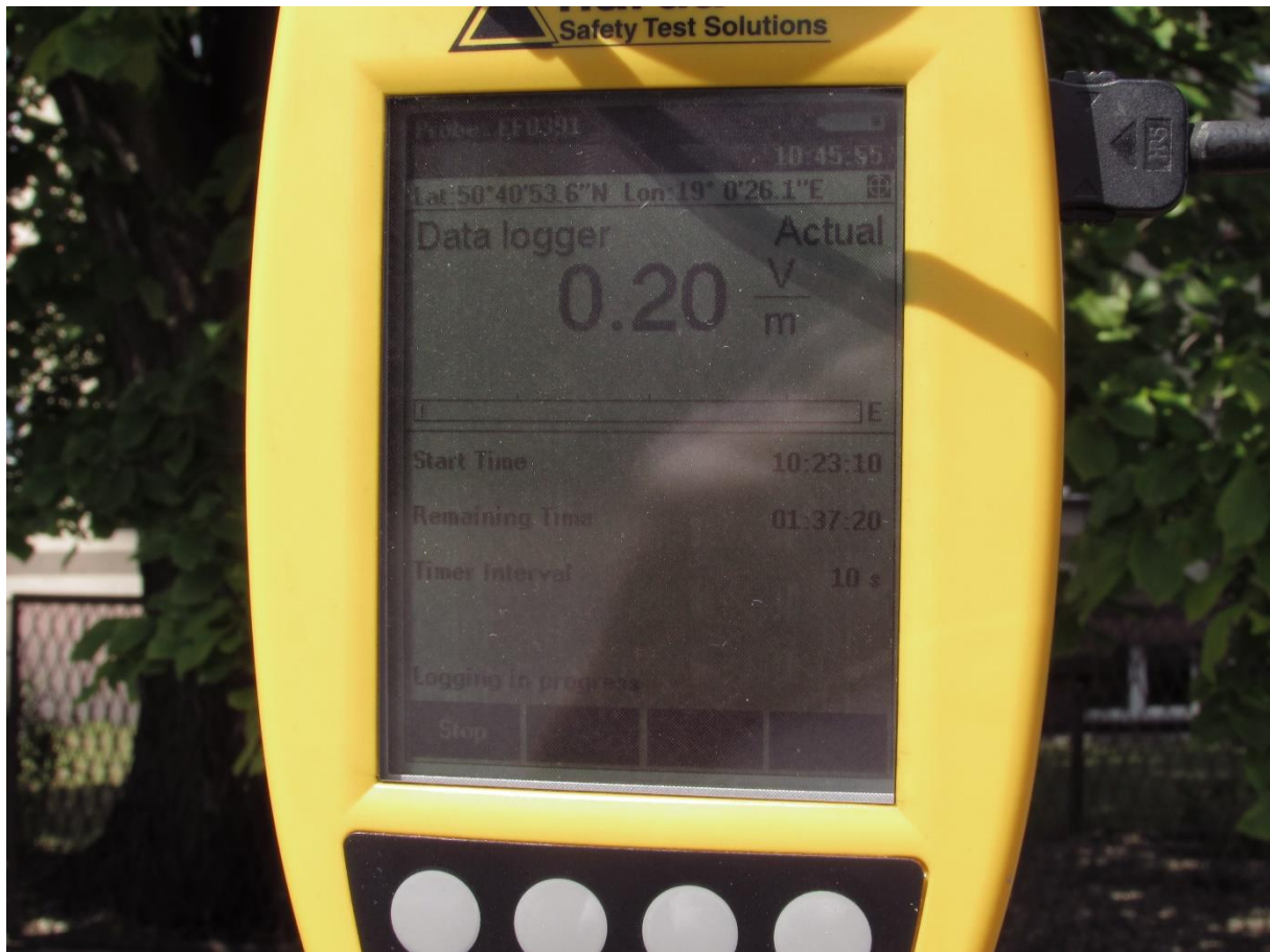
Fot. 3 Przyrząd pomiarowy w trakcie prowadzonego badania