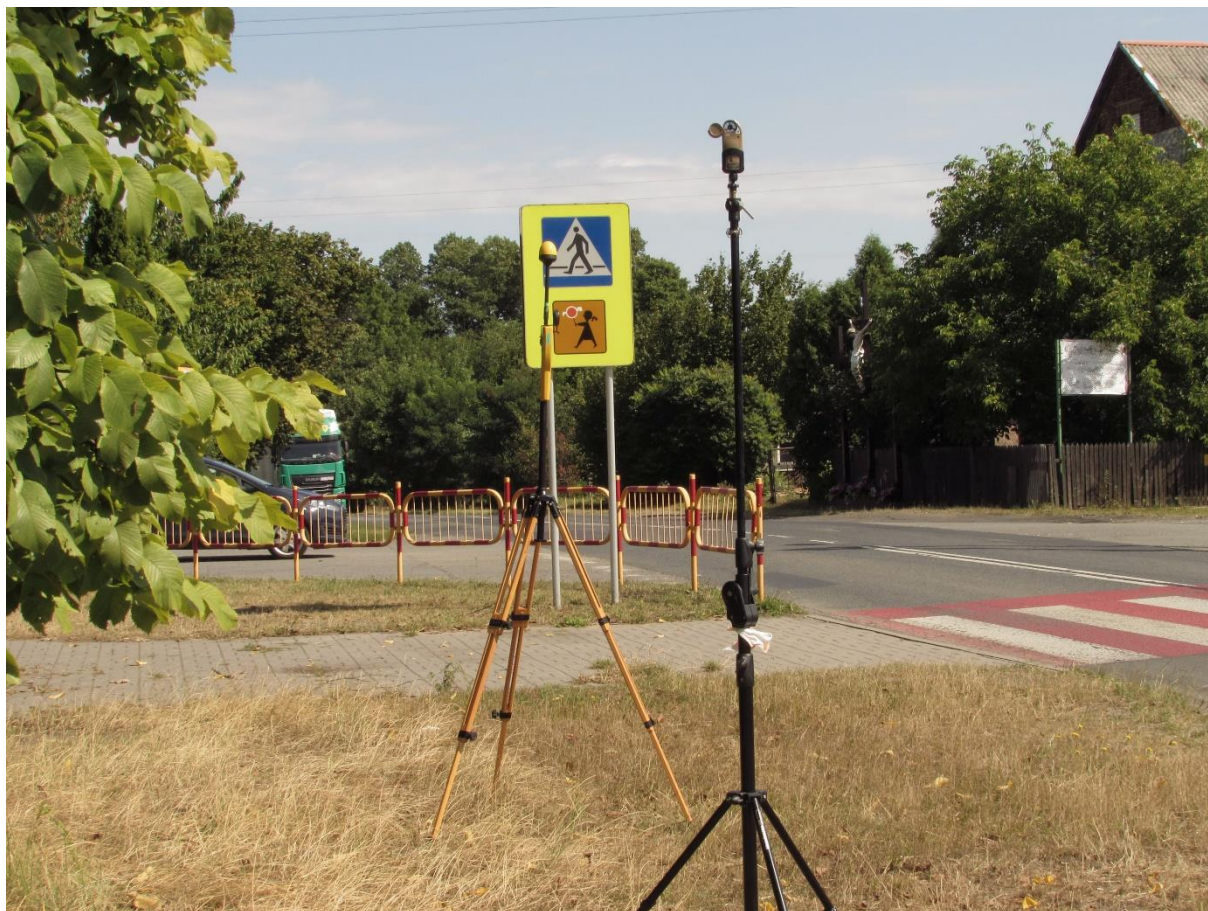
Fot. 1 Rejon badań, widok w kierunku północno - wschodnim (NE)