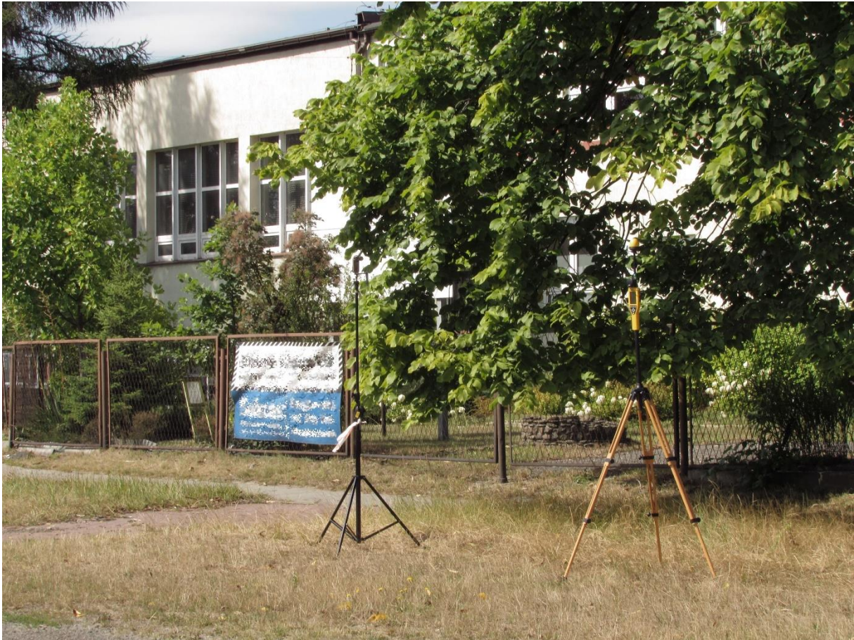
Fot 2. Rejon badań, widok w kierunku południowo – zachodnim (SW)