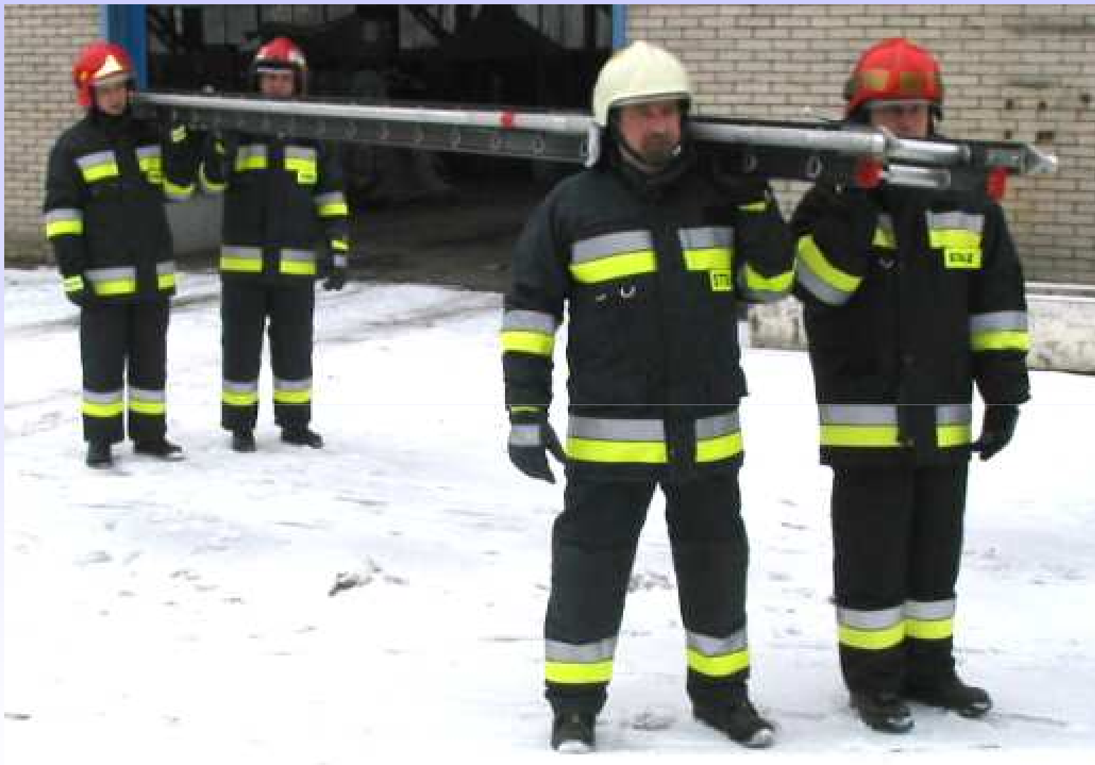
Transport drabiny na miejsce akcji