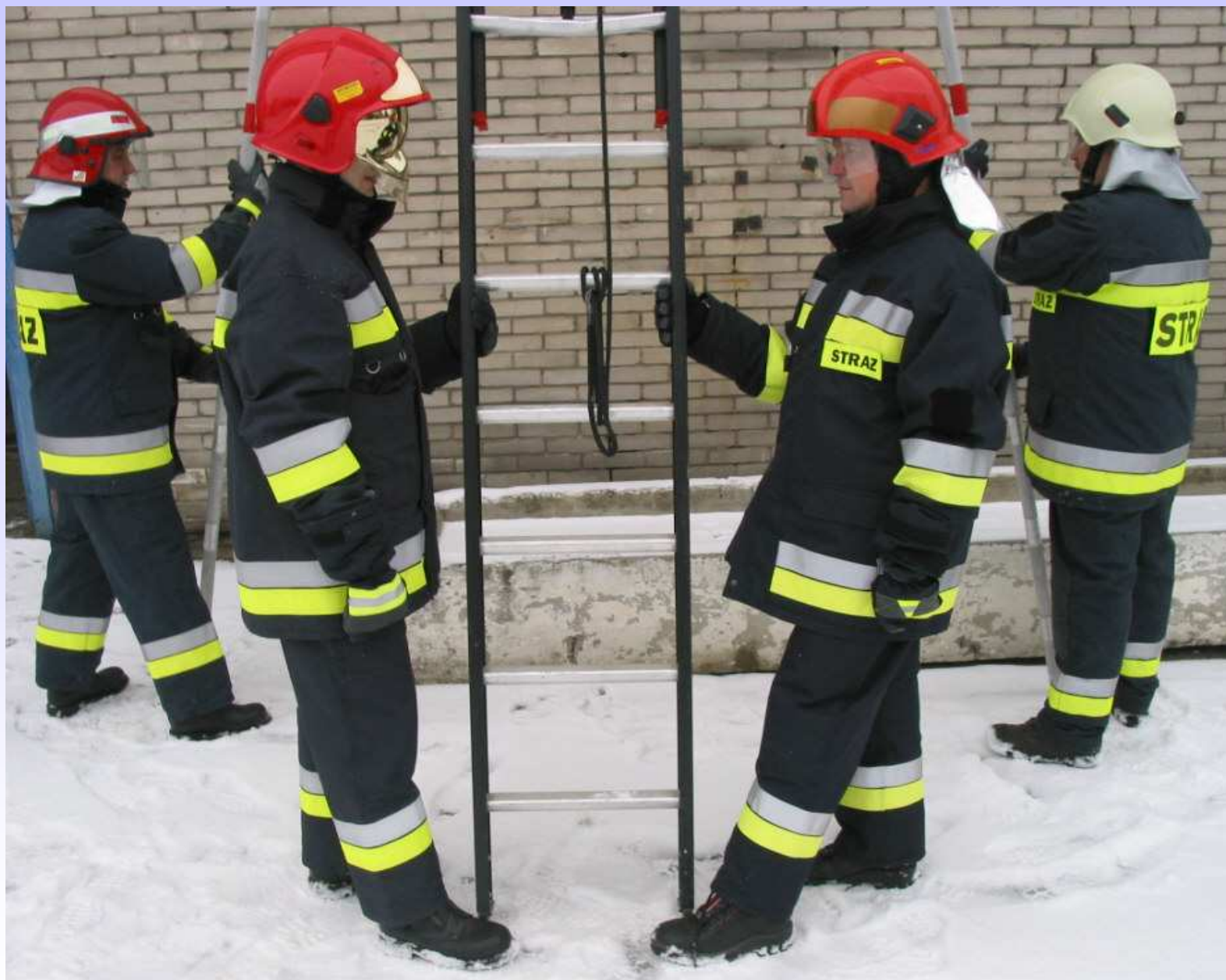
Asekuracja pracujących na drabinie.