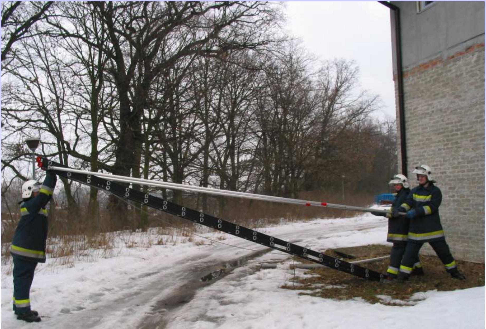
Podnoszenie drabiny do pozycji pionowej.