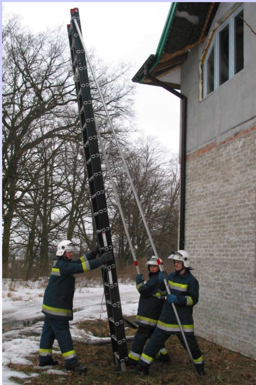
Pozycja przed oparciem drabiny o ścianę