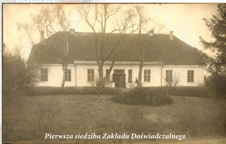
Pierwsza siedziba Zakładu Doświadczalnego

Na potrzeby Zakładu Doświadczalnego w Poświętnem wykonano mapy glebowe. W 1933 r. Państwowy Instytut Naukowego Gospodarstwa Wiejskiego w Puławach zbadał gleby na polu doświadczalnym (46 ha) i na polu rezerwowym (84 ha). Opracowano mapę gleb, mapę odczynu gleb wraz z siatką wierceń. Pole doświadczalne i zapasowe wydrenowano.