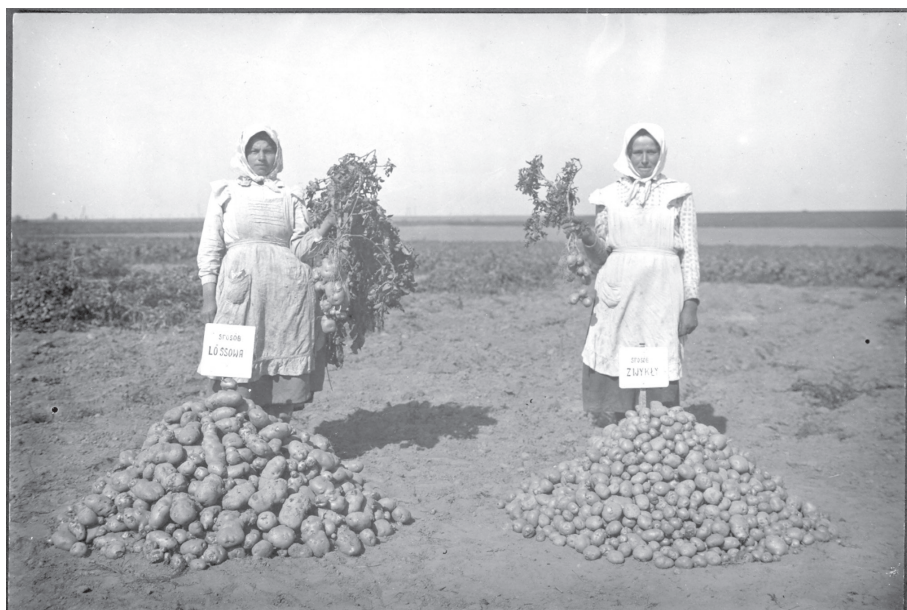
Prezentacja plonu ziemniaków w zależności od sposobu prowadzenia doświadczenia

Przestrzegano wyrównania pól, co trwało 4 lata. Doświadczenia prowadzono w płodozmianie 4-polowym. Powierzchnie pól