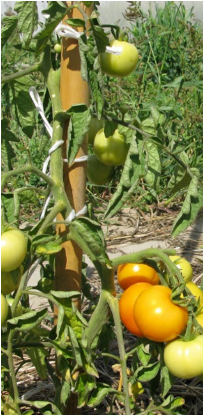
Odmiana Bursztyn wyhodowana została w Stacji Hodowli Roślin Ogrodniczych – Pass