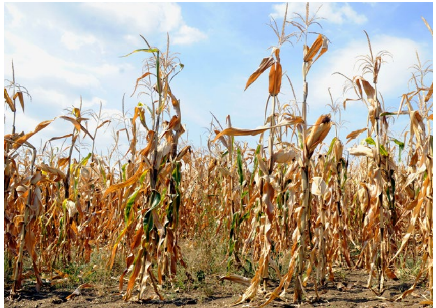
Do 29 grudnia 2023 r. rolnicy, których gospodarstwa zostały zniszczone w wyniku klęsk żywiołowych mogą składać w ARiMR wnioski o pomoc

O pomoc można wystąpić, gdy straty w gospodarstwie (w uprawach rolnych, zwierzętach