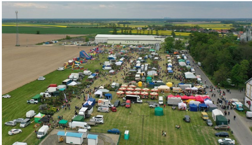
Organizowane przez OODR Targi Ogrodnicze „Wiosna Kwiatów” są najbardziej znaną imprezą plenerową w województwie

Minipasieka umożliwia prowadzenie obserwacji, dokonywanie odczytów i stałe monitorowanie pracy pszczół w ulu, a w dalszej kolejności – pozwala na transfer wiedzy pomiędzy pszczelarzami, producentami rolnymi oraz specjalistami z dziedziny pszczelarstwa.