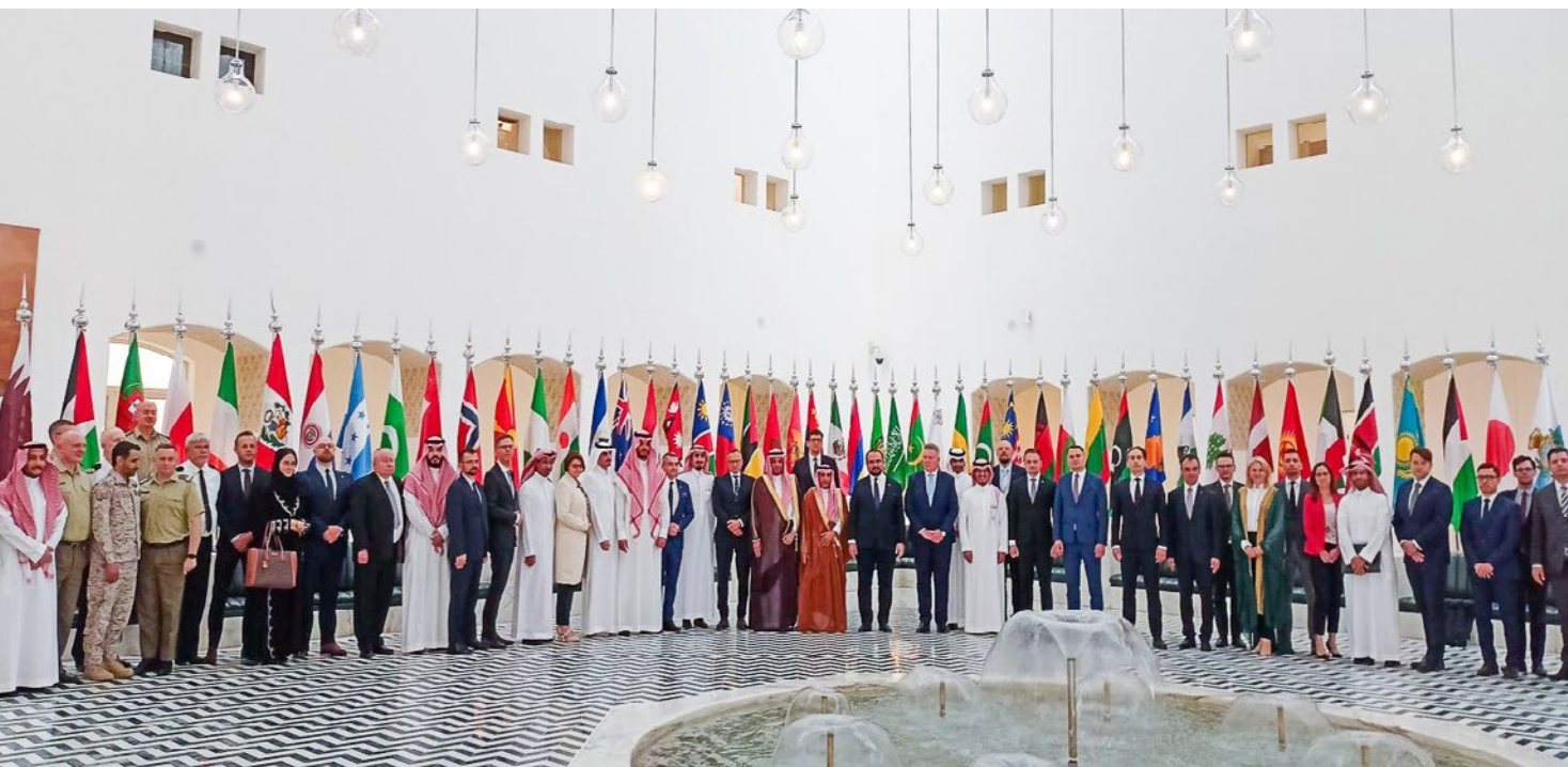
Uczestnicy IV posiedzenia polsko-saudyjskiej komisji wspólnej oraz polsko-saudyjskiego forum biznesu w Królestwie Arabii Saudyjskiej

KAS zwrócił uwagę, że kraj ten importuje zboże z Australii, natomiast nie wyklucza możliwości dywersyfikacji tego importu.