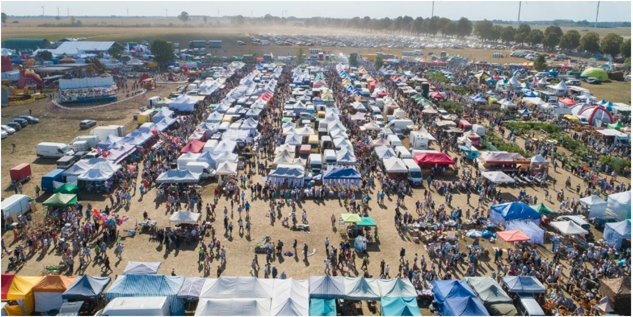
Targi Rolne „Agro Pomerania” to największa impreza rolnicza w regionie, gromadząca wielu wystawców, zarówno krajowych, jak i zagranicznych

Wystawa Hodowlana Koni oraz Międzynarodowa Wystawa Rękodzielnictwa.