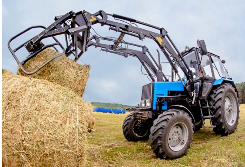
Zapisy ustawy wprowadzają dodatkową pomoc na obniżenie kosztów zakupu paliwa rolniczego nabytego w okresie od 1 lutego do 31 lipca 2023 r.

W celu ułatwienia realizacji wniosków składanych przez producentów rolnych o zwrot podatku akcyzowego w II terminie składania wniosków należy przyjąć, że podstawą do wypłaty dodatkowej pomocy (0,54 zł za 1 litr ON) jest art. 3 tej ustawy, w którym jest mowa o wniosku o zwrot podatku złożonym w terminie od 1 do 31 sierpnia 2023 r., do którego dołącza się faktury VAT lub ich kopie stanowiące dowód zakupu oleju napędowego w okresie od 1 lutego do 31 lipca 2023 r. Wzór wniosku w odniesieniu do świń, owiec, kóz i koni został udostępniony na stronie internetowej Ministerstwa Rolnictwa i Rozwoju Wsi. W odniesieniu do pozostałego na II termin składania wniosków limitu do użytków rolnych i bydła, obowiązuje wzór wniosku ogłoszony w rozporządzeniu Ministra Rolnictwa i Rozwoju Wsi z 20 grudnia 2018 r. w sprawie wzoru wniosku o zwrot