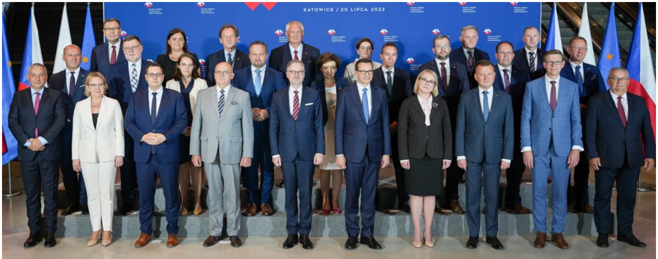
Polsko-czeskim konsultacjom międzyrządowym przewodniczyli premierzy obu krajów

Czeska wyrażają podobne zastrzeżenia wobec projektu. – Powinniśmy dążyć do wypracowywania wspólnego stanowiska do prezentowania w ramach prac na poziomie Rady – podkreślił minister Telus.