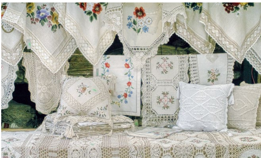
KGW pielęgnują i popularyzują lokalne tradycje, folklor i sztukę ludową