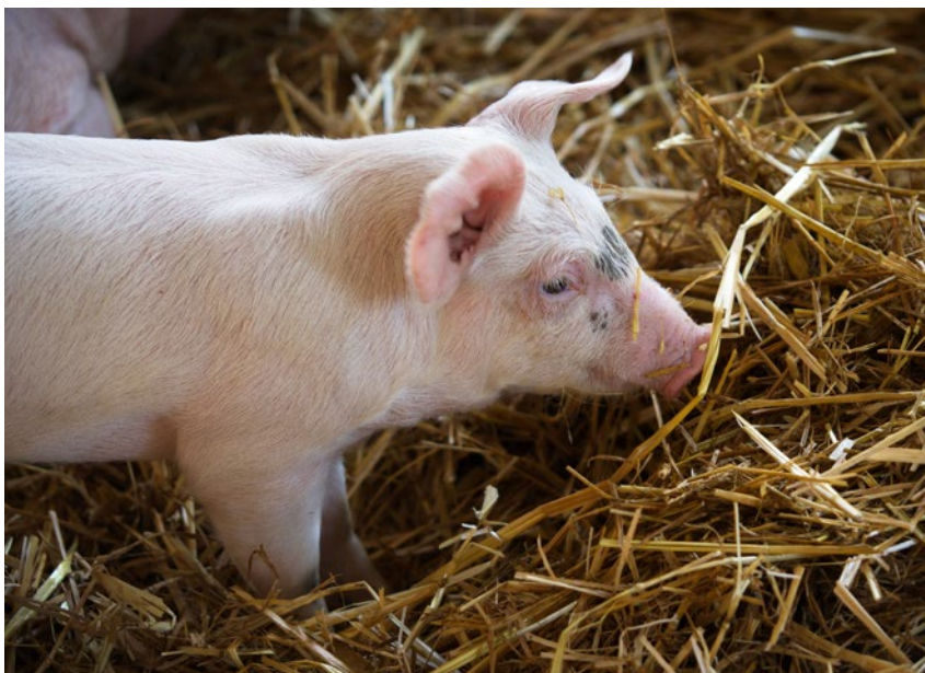
O wsparcie mogą również ubiegać się gospodarze, którzy ponieśli szkody spowodowane wystąpieniem ASF

gospodarskich) miały miejsce w roku, w którym jest składany wniosek lub w co najmniej jednym z dwóch poprzednich lat i wyniosły przynajmniej 30 proc. średniorocznej produkcji rolnej z trzech ostatnich lat. Co istotne, muszą one dotyczyć składowa gospodarstwa, którego odtworzenie wymaga poniesienia kosztów kwalifikujących się do objęcia wsparciem.