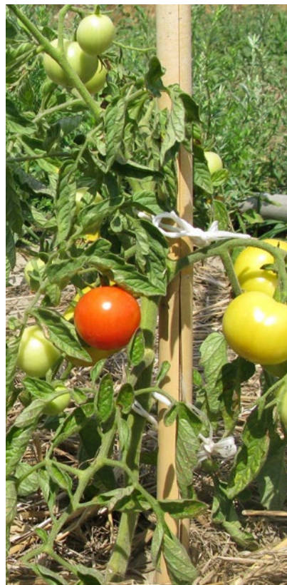
Odmiana pomidora Mory 33 wyhodowana w Stacji Hodowli Roślin Ogrodniczych Waganiec