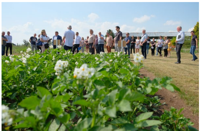
Na poletkach ZODR od kilkunastu lat organizowane są warsztaty polowe