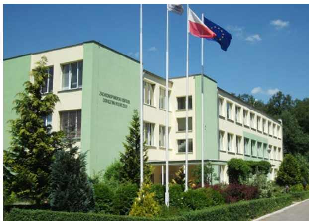
Zachodniopomorski Ośrodek Doradztwa Rolniczego w Barzkowicach

W tym roku, 8–10 września, odbędzie się jubileuszowa, bo już XXXV edycja Targów. Imprezie co roku towarzyszą m.in.: Wystawa Bydła Mięsnego i Mlecznego, Pokaz Zwierząt Hodowlanych, Wystawa Zwierząt Futerkowych, Pokaz Ptaków Hodowlanych i Ozdobnych, Zawody Jeździeckie w Skokach, Zachodniopomorska