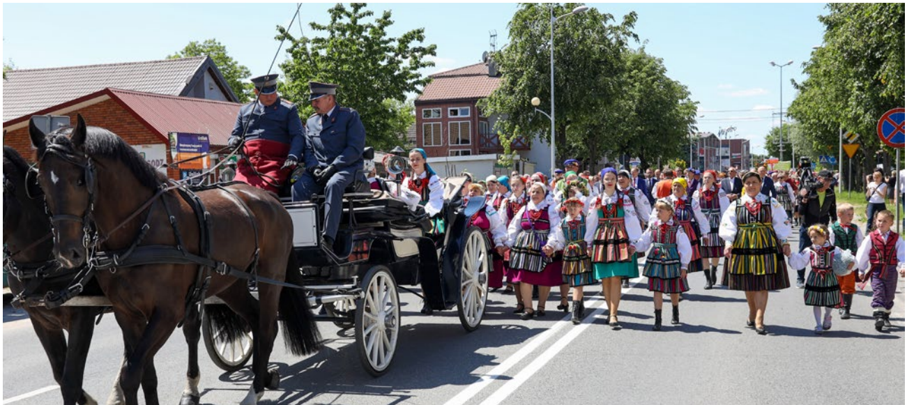
Koła są nieocenione w inicjowaniu lokalnych przedsięwzięć, integrując i aktywizując wokół ich realizacji lokalną społeczność. Na zdjęciu: Pierwsza Ogólnopolska Parada Kół Gospodyń Wiejskich w Opocznie

W bieżącym roku pieniędzy przeznaczonych na dofinansowanie kół jest aż około 120 mln zł. Wzrosły również – o 3 tys. zł – stawki dotacji, które wynoszą obecnie: 8 tys. zł – dla kół liczących nie więcej niż 30 osób; 9 tys. zł – jeśli liczba ta mieści się w przedziale 31–75 osób; 10 tys. zł – w przypadku jeszcze mniejszych kół. By KGW mogło wystąpić o dotację, musi być wpisane do Krajowego Rejestru Kół Gospodyń Wiejskich prowadzonego przez ARiMR. Co ważne, od tego roku koło musi posiadać także numer identyfikacyjny. Można go uzyskać