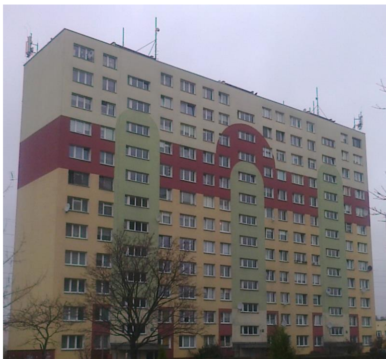
Fot. 1: Widok anten stacji bazowej ID: BT31063, zlokalizowanej pod adresem: ul. Limanowskiego 154, 91-034 Łódź