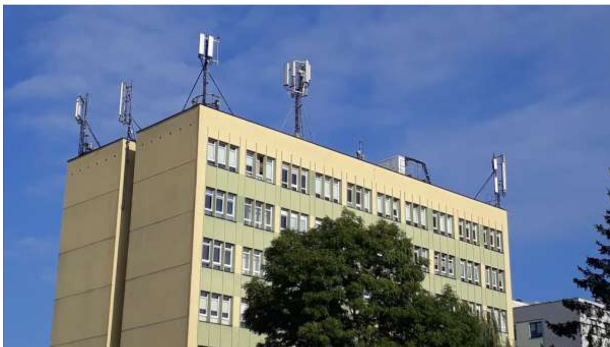
Fot. 1: Widoki anten stacji bazowych ID: KIE1048, ID: BT12470 oraz ID: 11747, zlokalizowanych: ul. Warszawska 34, 25-312 Kielce