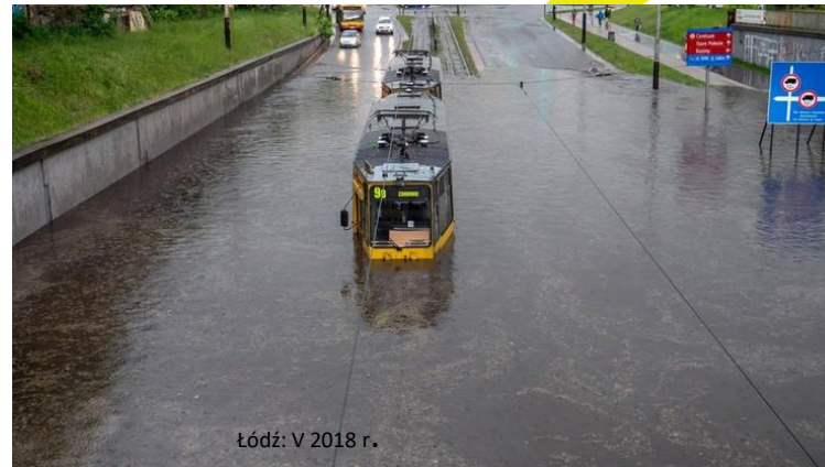
Łódź: V 2018 r.