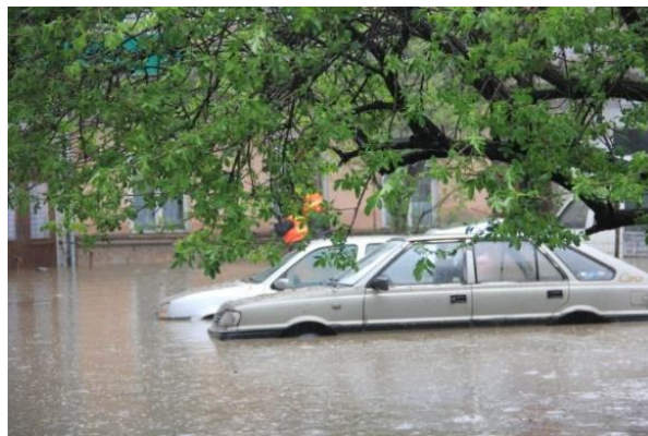
Brzeziny: IV 2015 r.