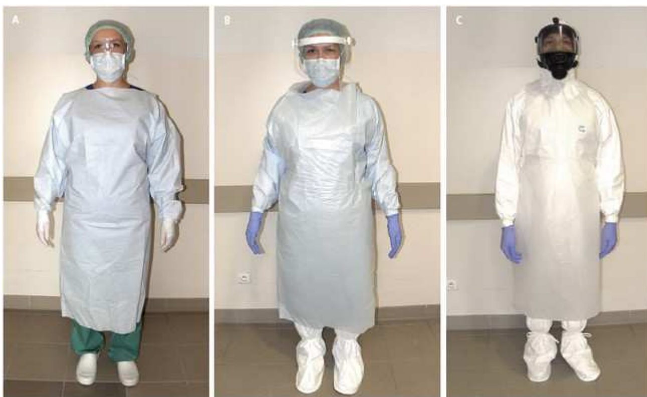
Ryc. 3. Środki ochrony indywidualnej: podstawowe (A), dodatkowe (B) i specjalne (C). Zdjęcia wykonano w WSS im. J. Gromkowskiego we Wrocławiu.

Przed przystąpieniem do badania pracownik medyczny jak najszybciej powinien założyć PPE. Jeśli istniało ryzyko kontaminacji skóry rąk, przed włożeniem rękawiczek powinien umyć lub zdezynfekować ręce (p. Dodatek, część D ). Do badania podmiotowego i przedmiotowego (w tym pomiaru temperatury i ciśnienia) wystarczy być ubranym w podstawowe PPE (ryc. 3A), jeśli jednak pacjent wymiotuje, ma biegunkę lub krwawi, należy użyć dodatkowych lub specjalnych PPE (ryc. 3B i 3C). Sposób zakładania i zdejmowania PPE przedstawia rycina 4.