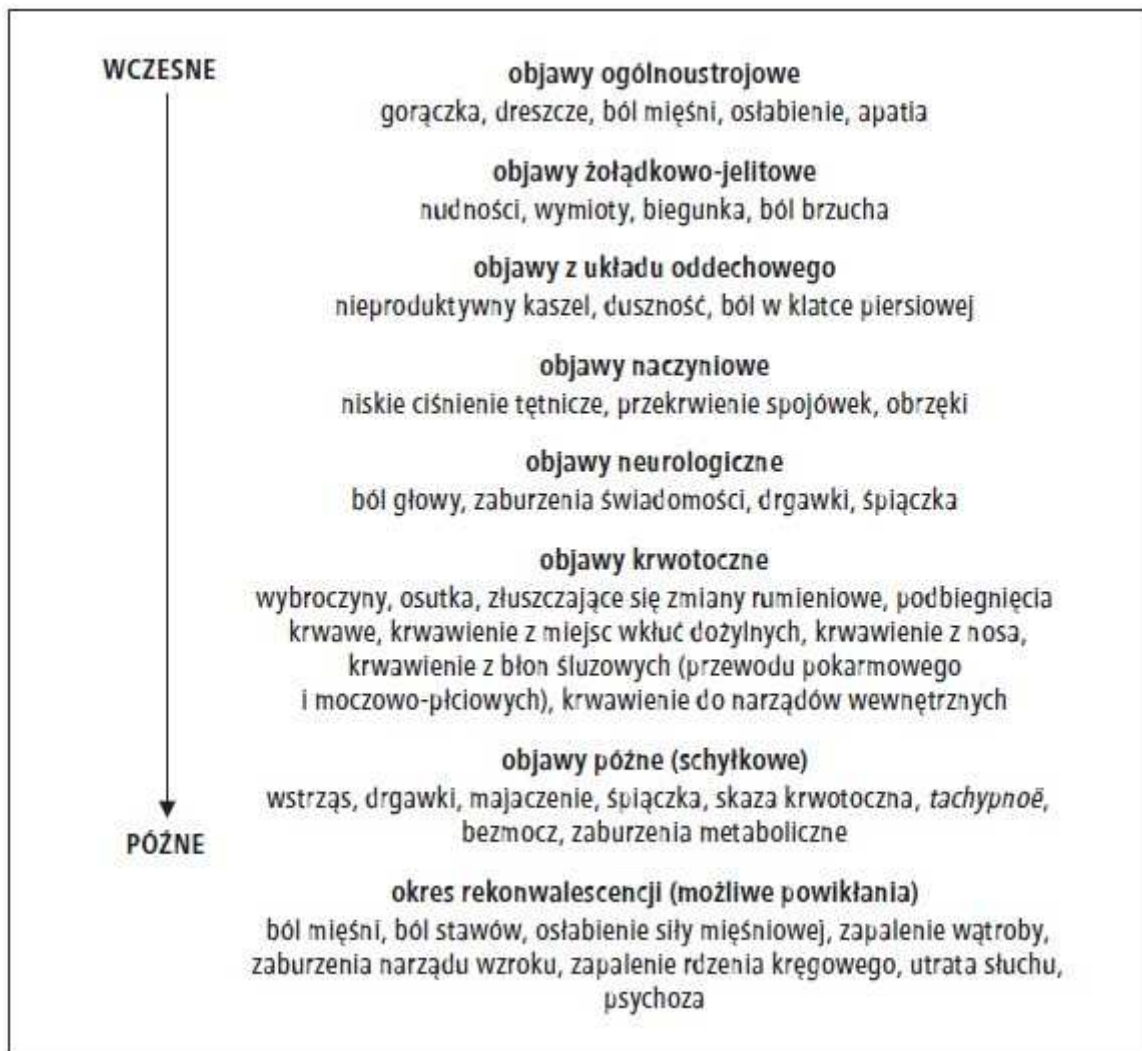
Ryc. 2. Objawy i przebieg kliniczny gorączki Ebola

Objawy i przebieg kliniczny EVD przedstawia rycina 2. Pierwsze objawy choroby pojawiają się w ciągu 2–21 dni od zakażenia (najczęściej 8–10 dni). Początkowo dominują objawy niecharakterystyczne – gorączka, dreszcze, ból mięśni i osłabienie. Zwykle po kilku dniach dochodzi do wystąpienia objawów żołądkowo-jelitowych: wodnistej biegunki, nudności i wymiotów oraz bólu brzucha. U części chorych rozwijają się powikłania narządowe, w tym neurologiczne, a u około połowy – zaburzenia krzepnięcia krwi, które pojawiają się zwykle 5. dnia od początku choroby i objawiają krwawieniem z błon śluzowych (przewodu pokarmowego, dziąseł, jamy nosowo-gardłowej, pochwy). Skaza krwotoczna jest spowodowana głównie zespołem rozsianego krzepnięcia wewnątrznaczyniowego i/lub niewydonością wątroby. Zgony w przebiegu EVD występują typowo w okresie od 6. do 16. dnia od pojawienia się objawów i są wynikiem niewydolności wielonarządowej i wstrząsu.