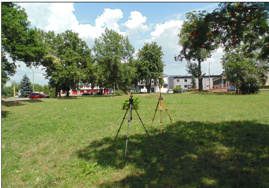
Fot.1. Rejon badań, widok w kierunku północnym