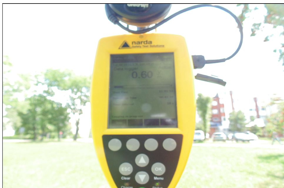
Fot.4. Przyrząd pomiarowy w trakcie wykonywanego badania