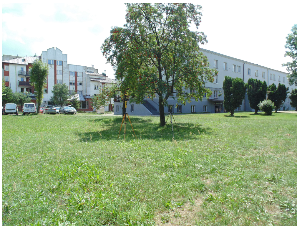
Fot.2. Rejon badań, widok w kierunku wschodnim