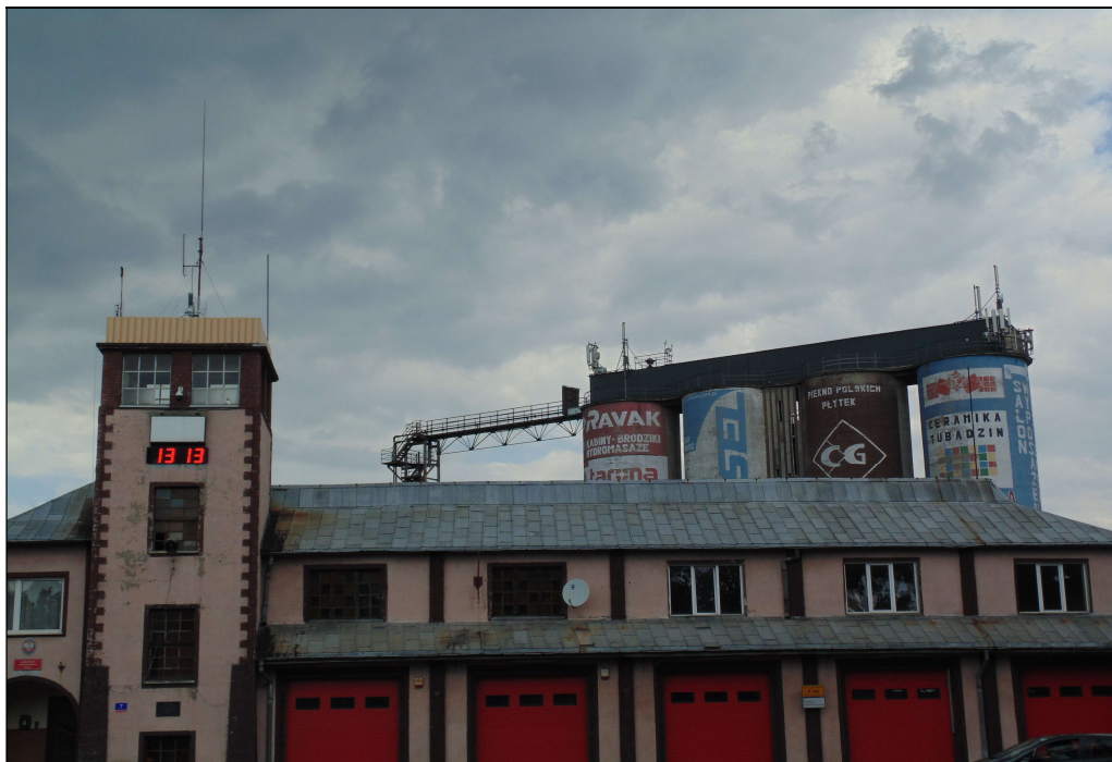
Fot.3. Lokalizacja instalacji radiokomunikacyjnych