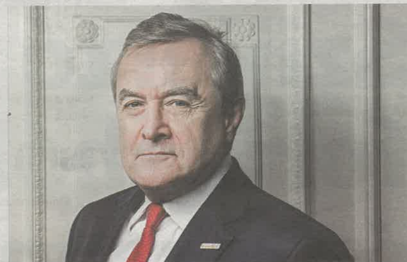
Piotr Glinski a kultúrát a modern gazdaság jelentős ágazatának tekinti, ezért az intézmények és munkahelyek védelmét fontos célnak tartja

lis intézményt sem. A kulturális intézmények és munkahelyek védelme az egyik fő célunk. A kulturális ágazatnak nyújtott támogatások eddigi összértékét hatmilliárd zlotyra (hozzávetőlegesen 475 milliárd forintnak megfelelő összeg – a szerk.) lehet becsülni. Az azonban már most nyilvánvaló, hogy ennek a segítségnek és támogatásnak sokkal mélyebbnek és szisztematikusabbnak kell lennie. További kihívás lesz a nyilvánosság meggyőzése a kulturális intézményekbe való visszatérésre. Úgy gondolom, hogy ez a téma uralja majd a megbeszéléseinket, találkozóinkat és konzultációinkat, leg-