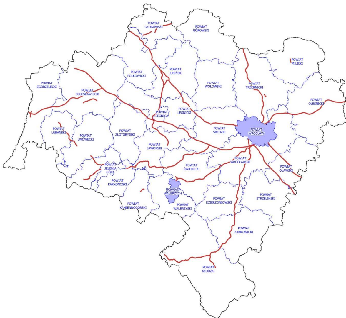
Rysunek 32. Lokalizacja analizowanych odcinków