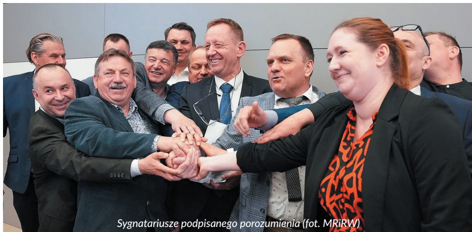
Sygnatariusze podpisanego porozumienia

Z pomocy wyłączone są powierzchnie, na które przyznano pomoc finansową w ramach działania „Działanie rolno-środowiskowo-klimatyczne” objętego Programem Rozwoju Obszarów Wiejskich na lata 2014-2020, za realizację zobowiązań rolno-środowiskowo-klimatycznych, w ramach których obowiązuje całkowity zakaz nawożenia.