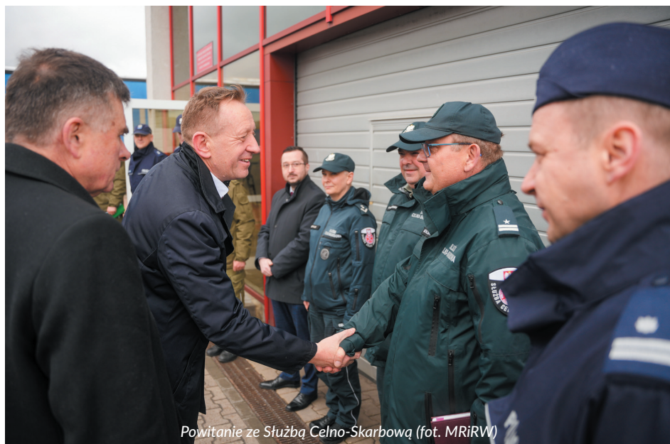
Powitanie ze Służbą Celno-Skarbową

Wypłata zwrotu podatku akcyzowego nastąpi w terminie od 2 do 31 października 2023 r. gotówką w kasie urzędu gminy lub miasta albo przelewem na rachunek bankowy podany we wniosku.