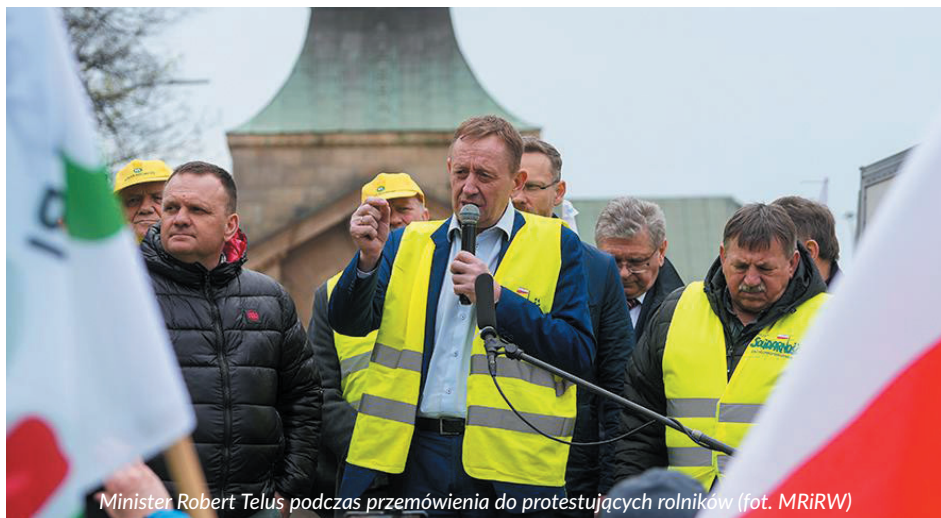
Minister Robert Telus podczas przemówienia do protestujących rolników

Pomoc przeznaczona będzie dla rolników, którzy złożyli w 2023 r. wniosek o płatności bezpośrednie.