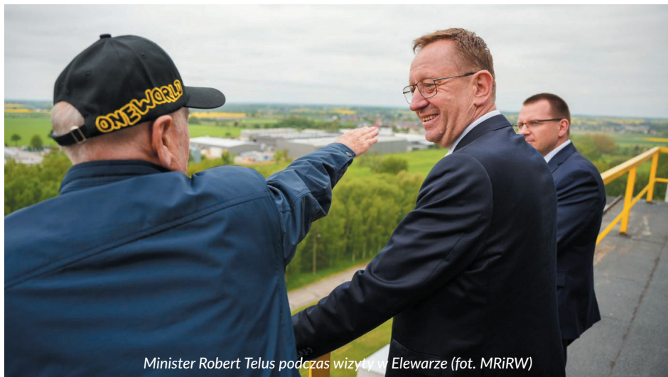
Minister Robert Telus podczas wizyty w Elewarze

Natomiast w odniesieniu do świń, kóz, owiec i koni formularz wniosku udostępniony został w Biuletynie Informacji Publicznej na stronie Ministerstwa Rolnictwa i Rozwoju Wsi.