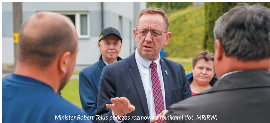
Minister Robert Telus podczas rozmowy z rolnikami

Aby uzyskać zwrot podatku akcyzowego, należy w terminie od 1 do 31 sierpnia 2023 r. złożyć odpowiedni wniosek do wójta, burmistrza (lub prezydenta miasta), właściwego ze względu na miejsce położenia gruntów będących w posiadaniu lub współposiadaniu producenta rolnego.