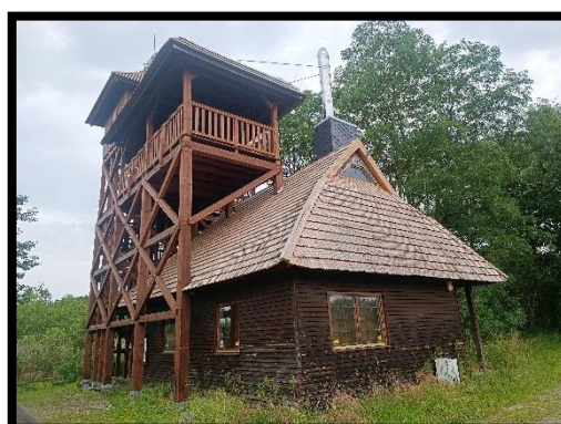
Fot. Małgorzata Denis - strażnicówka