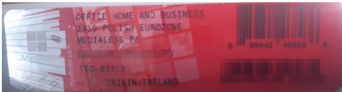
Rys. 2. Przykładowy kod zabezpieczony przez producenta systemu Microsoft Windows Office Home&Business z wymazanym, znajdującym się w prawym dolnym rogu numerem seryjnym produktu. Kod licencyjny znajduje się w środku szczelnie zapakowanego i zafoliowanego pudełka (Rys. 3)