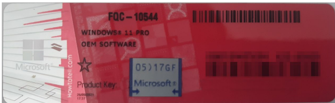
Rys. 1. Przykładowy kod zabezpieczony przez producenta systemu Microsoft Windows 11 (takie same naklejki mają Windows 10) z wymazanym, znajdującym się przed i za szarą naklejką kodem licencyjnym

„Wykonawca zobowiązany jest do dostarczenia fabrycznie nowego systemu operacyjnego nieużywanego oraz nie aktywowanego nigdy wcześniej na innym urządzeniu oraz pochodzącego z legalnego źródła sprzedaży. W przypadku systemu operacyjnego naklejka hologramowa winna być zabezpieczona przed możliwością odczytania klucza za pomocą zabezpieczeń stosowanych przez producenta”? Poniższe zdjęcie obrazuje obecnie stosowane zabezpieczenia producenta firmy Microsoft (klucz systemu jest zabezpieczony naklejką hologramową przez producenta. Po jej zdrapaniu uzyskujemy dostęp do oryginalnego klucza):