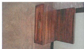
15 QR (809-13-1)