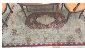
90 QR 2.3x1.6 m (008-391)