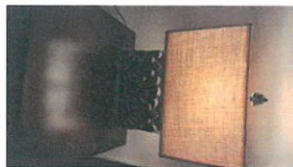
10 QR (008-384b)