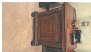
22.5 QR (809-1a)