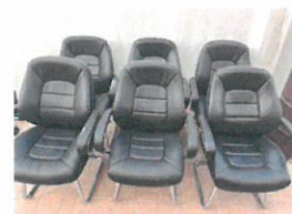
42 QR 6 pcs. (008-450)