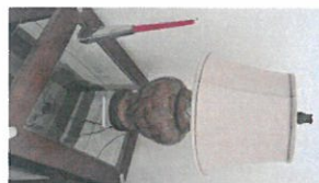
15 QR (008-333d)