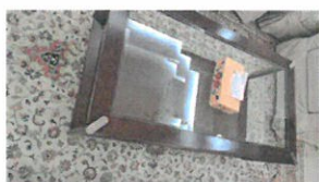
60 QR (008-378)