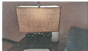
10 QR (008-384a)