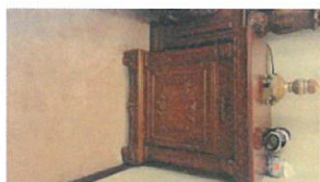
22.5 QR (809-1b)