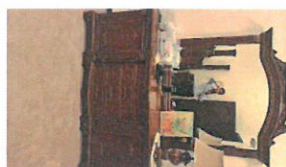
55 QR (809-1-1b)