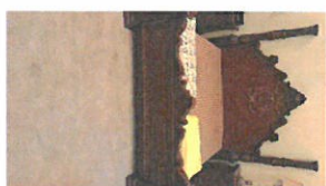
90 QR (809-1-1a)