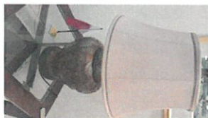
15 QR (008-333c)