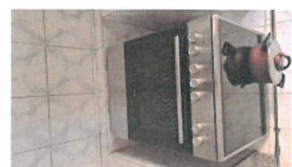
50 QR year 2020 (008-584)