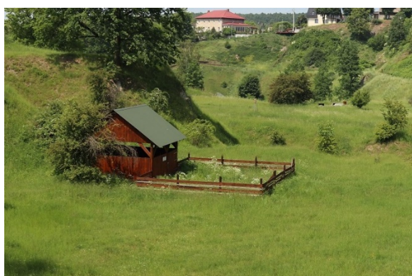
Fot.2 Widok na zadaszoną zagrodę dla owiec.