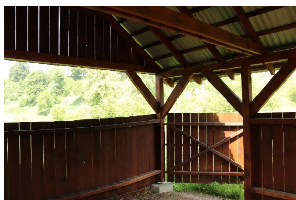
Fot.3 Wnętrze zagrody dla owiec.