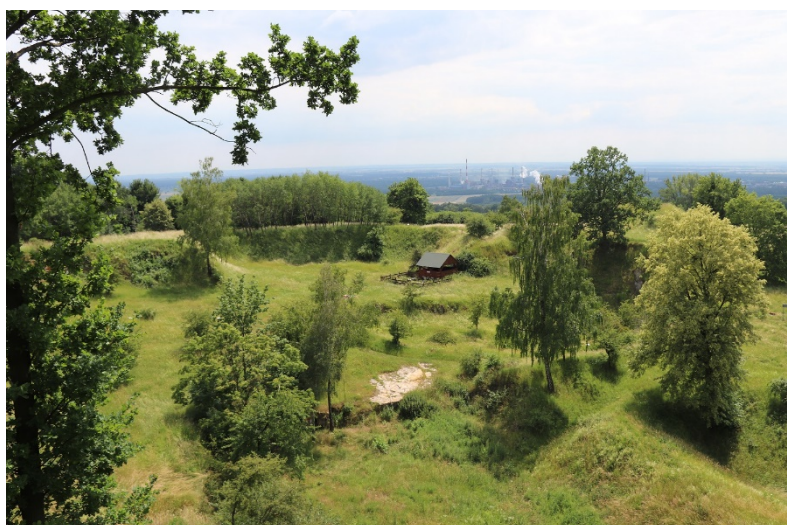
Fot.1 Widok na obszar przeznaczony do wypasu owiec na stanowisku w Górze Św. Anny.

REGIONALNA DYREKCJA OCHRONY ŚRODOWISKA W OPOLU