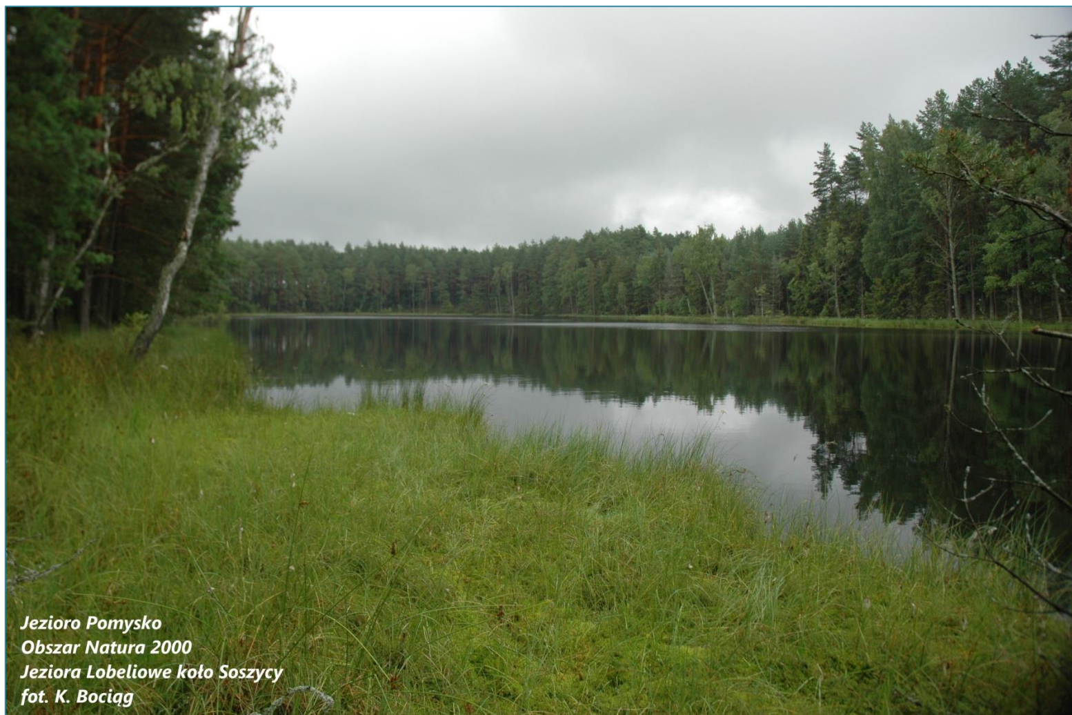
Jezioro Pomysko Obszar Natura 2000 Jeziora Lobeliowe koło Soszycy