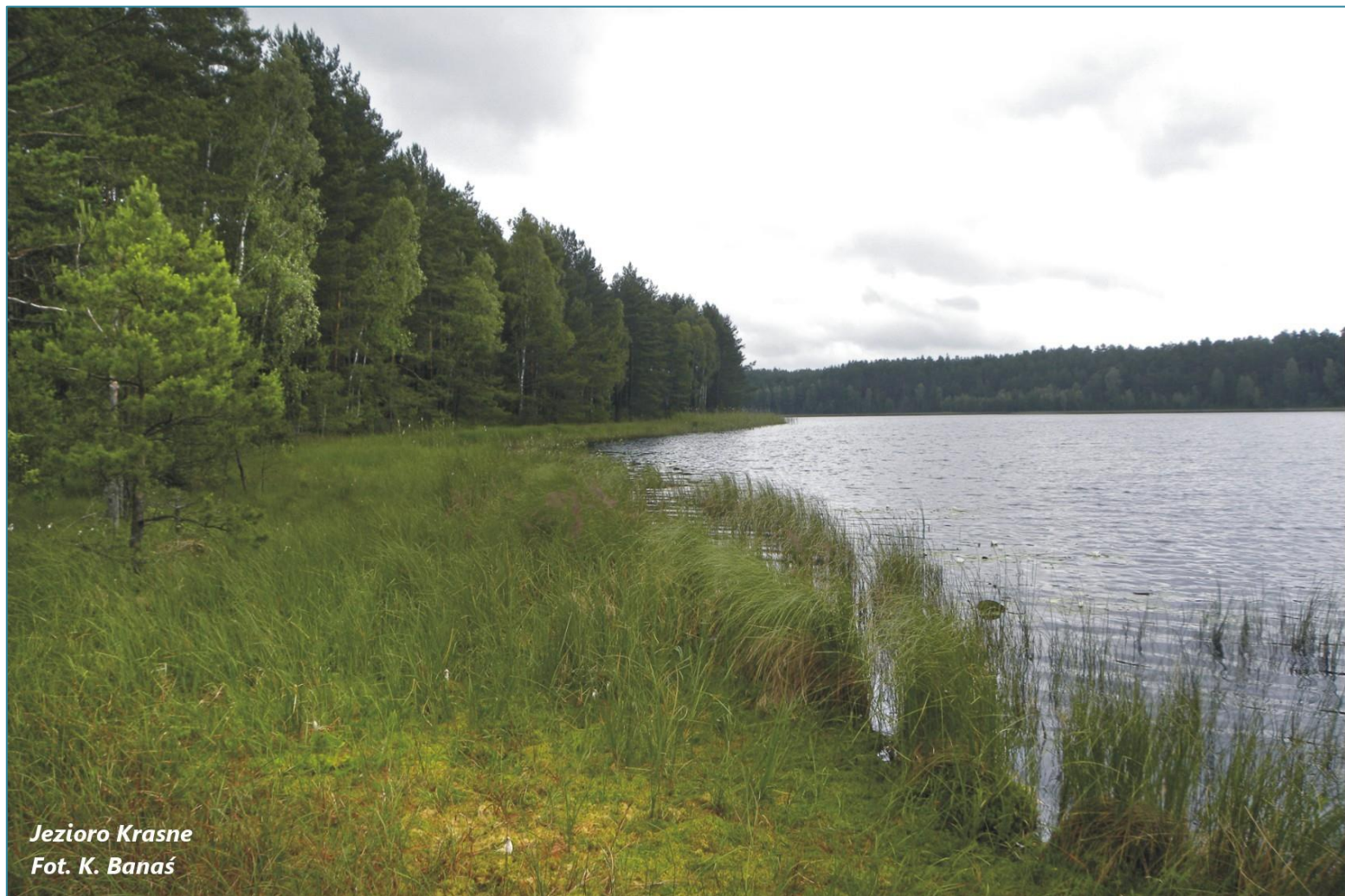
Jezioro Krasne