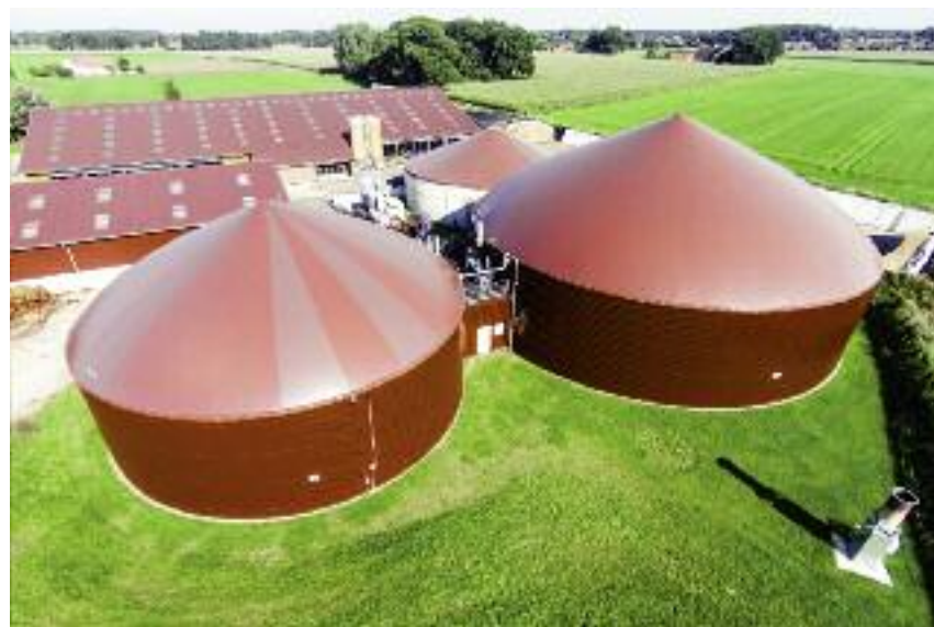
Zmiany wprowadzone w ustawie o odnawialnych źródłach energii umożliwiają rozwój w Polsce spółdzielni energetycznych

Warto w tym miejscu przypomnieć, że zgodnie z ustawą z 10 kwietnia 1997 r. – Prawo energetyczne do zadań własnych gminy