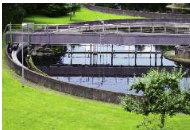
...jak również obiekty użyteczności publicznej: hydrofornie, studnie głębinowe, przepompownie, oczyszczalnie ścieków, drogi dojazdowe

Ważne jest również racjonalne wykorzystanie potencjału Zasobu. A to oznacza, że podstawowym kierunkiem rozdysponowania nieruchomości rolnych Zasobu jest ich wykorzystanie rolnicze. Natomiast nieruchomości inwestycyjne należy przeznaczyć na przedsięwzięcia sprzyjające efektywnemu podnoszeniu walorów gospodarczych terenu i aktywizacji ludności na obszarach wiejskich.