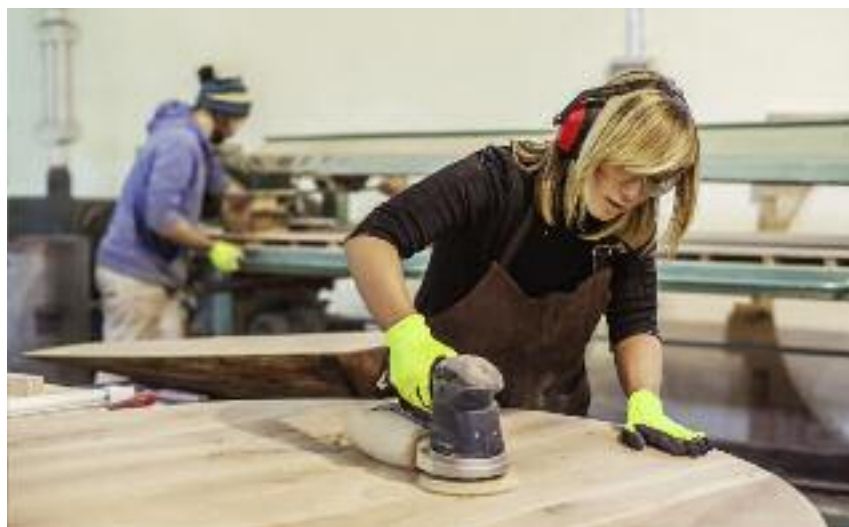
Nawet 250 tys. zł wsparcia może otrzymać rolnik, który planuje stworzyć w swojej firmie co najmniej trzy miejsca pracy

Natomiast dla rolników posiadających gospodarstwo rolne i szukających dywersyfikacji źródła dochodu przewidziano mechanizm wsparcia przetwarzania produktów z gospodarstwa. Przetwórstwo i marketing produktów rolnych , obok innych form przetwarzania produktów rolnych, wspiera również działalność dotyczącą rozpo-