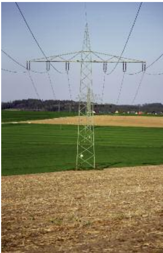
Oprócz korzyści wynikających z wytwarzania energii na własne potrzeby, spółdzielnie energetyczne będą zwolnione z wielu opłat

pozostających po rozliczeniu się ze spółdzielnią. Dodatkowo od ilości wytworzonej i zużytej energii przez spółdzielnię i jej członków nie będzie pobierana opłata OZE, opłata mocowa oraz opłata kogeneracyjna. Kolejnym ułatwieniem jest zwol-