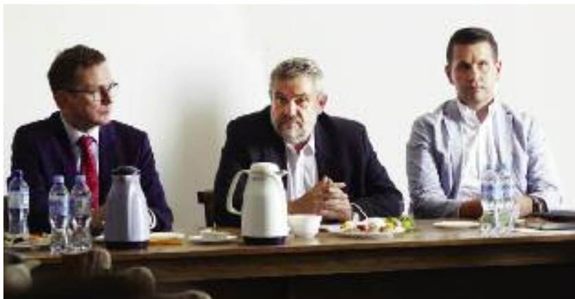
Zastosowanie danych teledetekcyjnych w rolnictwie było głównym tematem sierpniowego spotkania w Instytucie Geodezji i Kartografii w Warszawie

– To nie tylko oszczędność zużytego do prac polowych paliwa, ale także znaczne zmniejszenie zużycia nawozów, które są dostarczane bezpośrednio do roślin i gleby w bardzo precyzyjnych dawkach. Konsekwencją mniejszego zużycia paliwa i nawozów są niższe koszty prowadzenia gospodarstwa i jednocześnie zmniejsze-