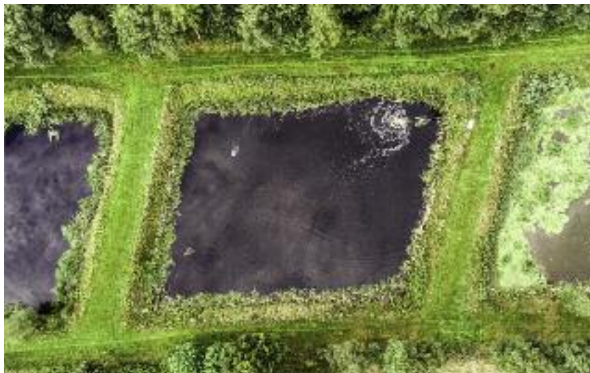
Odtwarzanie stawów hodowlanych jest jednym z działań przewidzianych w „Założeniach do Programu rozwoju retencji na lata 2021-2027”

tów rządowych, mających znaczenie dla przeciwdziałania skutkom suszy.