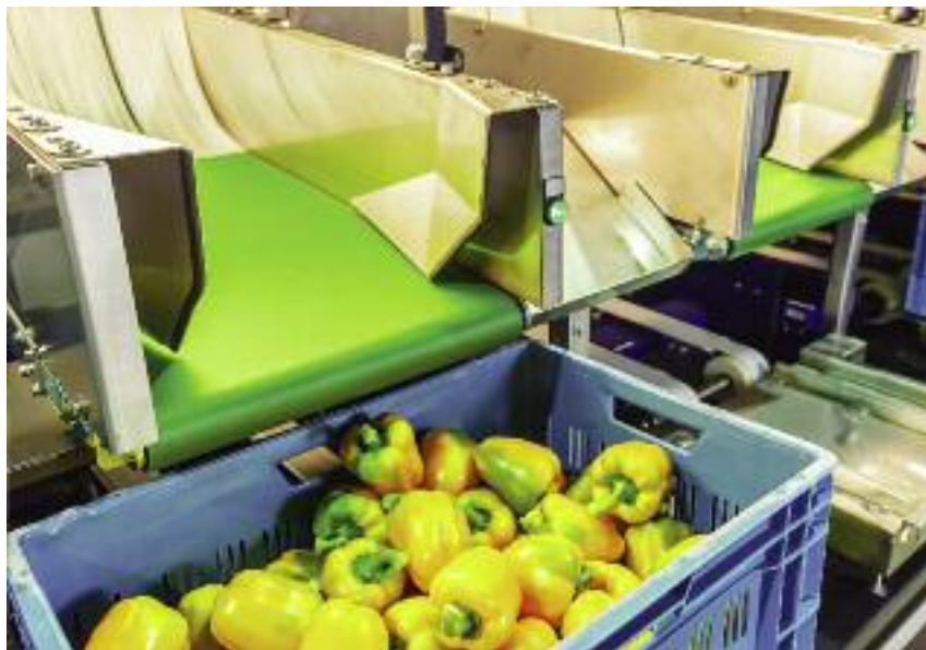
W ramach rolniczego handlu detalicznego możliwa jest nie tylko produkcja i przetwarzanie żywności...