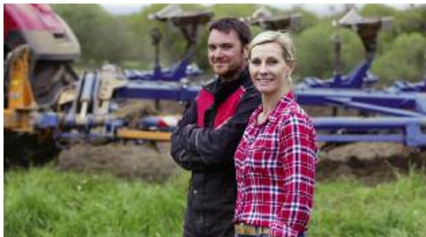
W projektowanej ustawie rozszerzony został katalog przypadków umożliwiających nadawanie małżonkom i współposiadaczom gospodarstw rolnych, odrębnych numerów identyfikacyjnych

Kolejna zmiana przewidziana w projekcie polega na skróceniu minimalnego okresu doświadczenia w pracy doradczej, wymaganego do uzyskania wpisu na listę doradców rolniczych, rolnośrodowiskowych i leśnych – z 1 roku do 6 miesięcy, oraz na wskazaniu, zgodnie z ustawą Prawo o szkolnictwie wyższym i nauce, 30 punktów ECTS jako niezbędnych do uzyskania w formie studiów podyplomowych wiedzy z zakresu rolnictwa. Przewi-