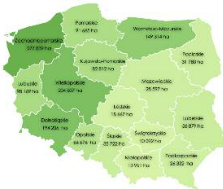
Powierzchnia gruntów w Zasobie WRSP w poszczególnych województwach (stan na 30.06.2019 r.)

Wydzierżawienie nieruchomości Zasobu WRSP następuje głównie w trybie przetargowym. Podstawowym rodzajem przetargów na dzierżawę jest przetarg ograniczony, w którym mogą uczestniczyć wyłącznie rolnicy indywidualni zamierzający powiększyć lub utworzyć gospodarstwo rodzinne. W okresie od początku stycznia do końca czerwca 2019 r. w całym kraju odbyło się ponad 4,4 tys. przetargów na dzierżawę. Przedłużono ponad 1,4 tys. umów dzierżawy na powierzchnię prawie 35,5 tys. ha.