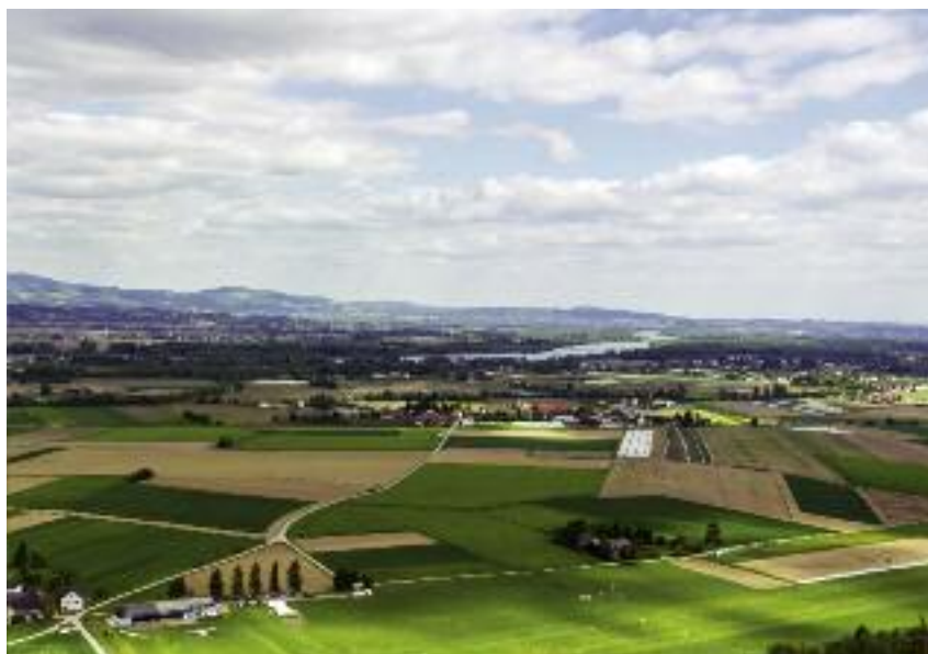
Podstawową formą zagospodarowania gruntów rolnych Zasobu jest dzierżawa

two, oprócz nieruchomości rolnych, ma bardzo atrakcyjną ofertę gruntów nierolnych. Ich atutami są przede wszystkim znakomita komunikacja i duża powierzchnia, na któ-