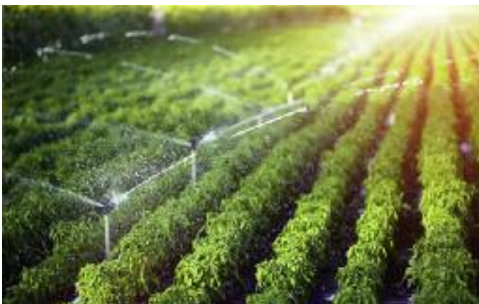
Jeszcze w tym roku rolnicy będą również mogli ubiegać się o pomoc finansową na inwestycje w tzw. małą retencję

dostosowanie pomieszczeń do przechowywania produktów żywnościowych oraz służących przygotowaniu posiłków, zakup potrzebnych do tego sprzętów i urządzeń.