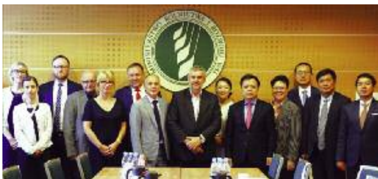
W pierwszych dniach sierpnia minister rolnictwa Jan Krzysztof Ardanowski gościł grupę chińskich przedsiębiorców

Chiny pozostają krajem priorytetowym w promocji polskiego sektora rolno-spożywczego, z uwagi na bardzo duże zainteresowanie polskich przedsiębiorców chińskim rynkiem. Polska odnotowuje wysokie ujemne saldo handlowe w obrocie artykułami rolno-spożywczymi z Chinami, które w 2018 r. wyniosło -252,1 mln euro. W 2018 r. wartość eksportu do Chin wzrosła o 26% (w porównaniu