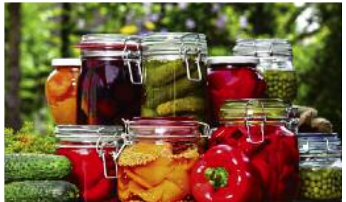
W październiku br. ma ruszyć nabór wniosków na „Przetwórstwo i marketing produktów rolnych”. Wnioski o wsparcie będą mogli składać rolnicy, którzy zajmują się lub chcą podjąć działalność w ramach RHD