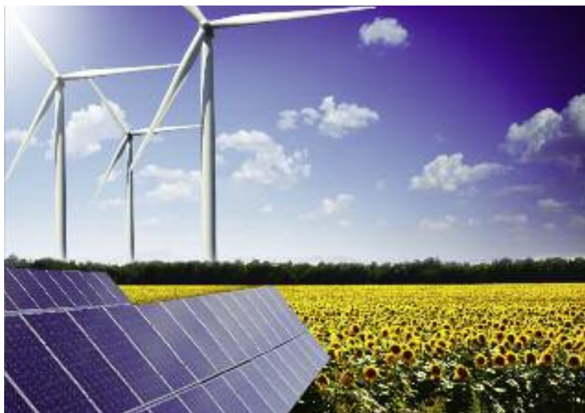
Spółdzielnia energetyczna ma produkować i zużywać energię wyłącznie na potrzeby własne i swoich członków

Wszystkie instalacje muszą stanowić własność spółdzielni energetycznej lub jej członków i być podłączone do sieci tego samego operatora systemu dystrybucyjnego elektroenergetycznego. Przepisy nakładają