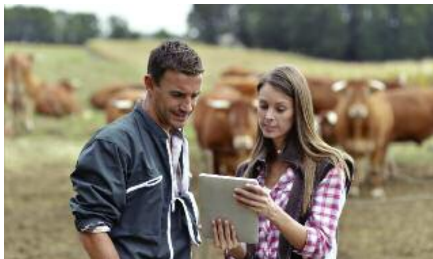
Modyfikacja portalu IRZplus pozwala m.in. w łatwiejszy sposób zgłaszać zwierzęta do rejestru, informować o ich przemieszczeniach, wnioskować o numery kolczyków i paszporty