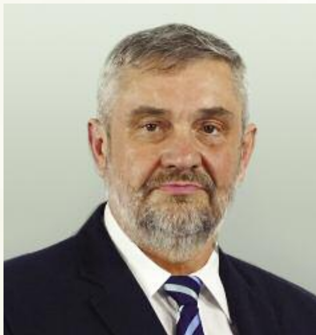
Jan Krzysztof Ardanowski, minister rolnictwa i rozwoju wsi