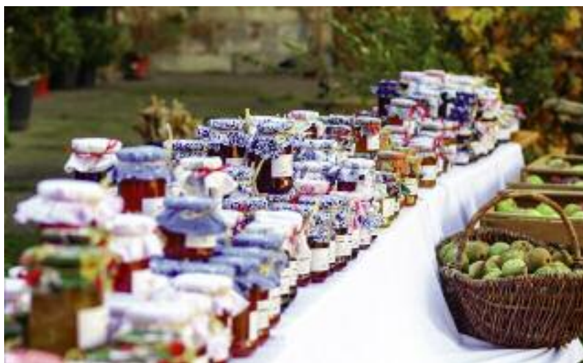
...ale również jej sprzedaż konsumentowi finalnemu

niających działalność gospodarczą w zakresie przetwarzania produktów rolnych i nie mniej niż 10 tys. zł na operację;