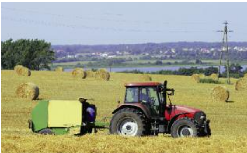
Podstawowym kierunkiem rozdysponowania nieruchomości rolnych Zasobu jest ich wykorzystanie rolnicze

Nowością, którą umożliwia nowelizacja (art. 24b), jest tworzenie na gruntach Zasobu ośrodków produkcji rolniczej (OPR), definiowanych jako wyodrębnione z Zasobu nieruchomości, tworzące wraz z innymi składnikami mienia nierozdzielalną, zorganizowaną całość gospodarczą o powierzchni przekraczającej 50 ha, której podział byłby nieuzasadniony ekonomicznie. Utworzenie ośrodków produkcji rolniczej uwarunkowane jest uzyskaniem zgody Ministra Rolnictwa i Rozwoju Wsi. Gospodarowanie nimi odbywa się w drodze oddania