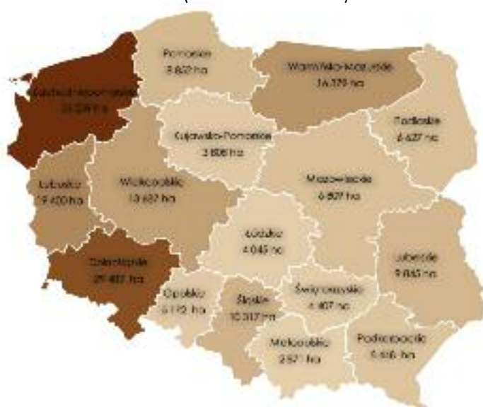
Grunty do rozdysponowania w podziale na województwa (stan na 30.06.2019 r.)

KOWR każdego roku sprzedaje około 1000 ha nieruchomości nierolnych, a wpływy z ich sprzedaży wynoszą około 350-400 mln zł.