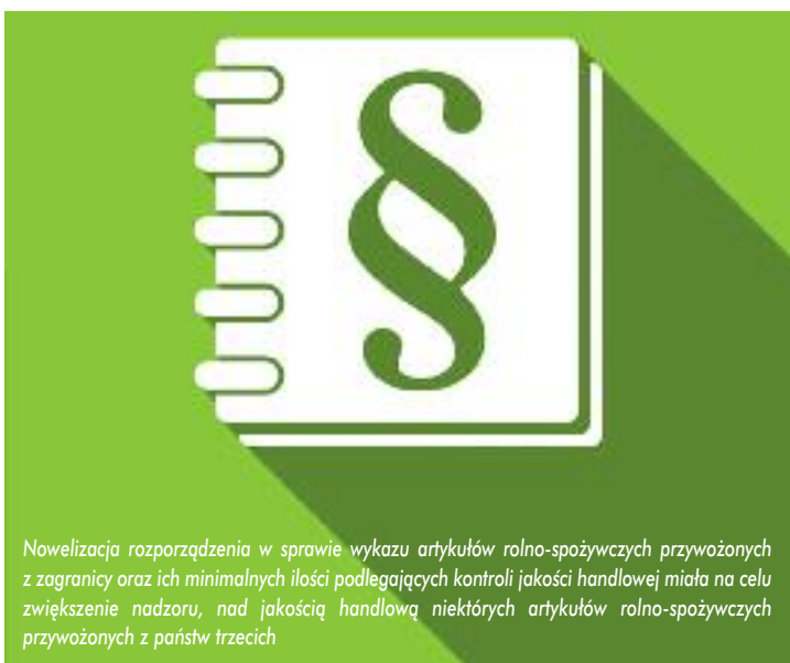
Nowelizacja rozporządzenia w sprawie wykazu artykułów rolno-spożywczych przywożonych z zagranicy oraz ich minimalnych ilości podlegających kontroli jakości handlowej miała na celu zwiększenie nadzoru nad jakością handlową niektórych artykułów rolno-spożywczych przywożonych z państw trzecich

Wedle powyższego dokonano zmiany treści załącznika do bazowego rozporządzenia poprzez rozszerzenie wykazu o ww. pozycje taryfowe ze wskazaniem ww. ilości minimalnych danych artykułów rolno-spożywczych podlegających kontroli jakości handlowej. Rozporządzenie weszło w życie 17 sierpnia 2019 r.