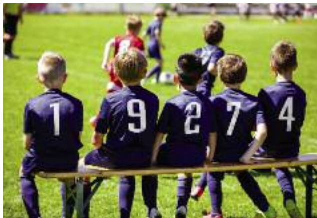
Na gruntach przekazanych nieodpłatnie samorządom lokalnym powstają szkoły i boiska sportowe, place zabaw, tereny rekreacyjne...

zastrzeżeń do przetargu. Zwiększono wysokość wynagrodzenia za korzystanie z nieruchomości bez tytułu prawnego do wysokości stanowiącej 30-krotność wywoławczej wysokości czynszu, który byłby należy