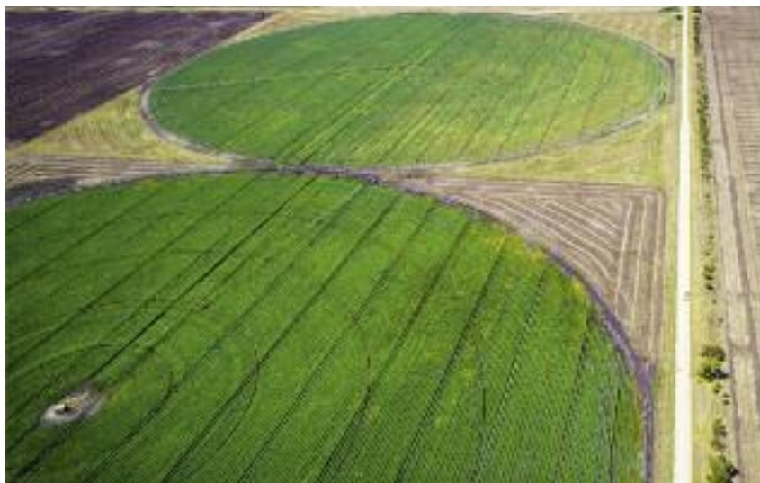
W ramach „Modernizacji gospodarstw rolnych” wyodrębniono obszar dotyczący nawadniania w gospodarstwach rolnych. Na ten obszar wsparcia przeznaczono 100 mln euro

Projekt rozporządzenia zmieniającego rozporządzenie Ministra Rolnictwa i Rozwoju Wsi z 21 sierpnia 2015 r. w sprawie szczegóło-