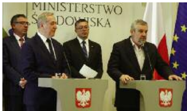
Program „AgroEnergia” skierowany jest do rolników indywidualnych chcących zainwestować m.in. w OZE – podkreślali na wspólnej konferencji prasowej ministrowie środowiska Henryk Kowalczyk i rolnictwa Jan Krzysztof Ardanowski

– Polskie rolnictwo może być jedną wielką zieloną elektrownią. W kontekście zarówno produkcji biomasy, jak również instalowania paneli fotowoltaicznych, kolektorów słonecznych, pomp ciepła, kogeneracyjnych kotłów, a także wiatraków, tam gdzie będą one akceptowane społecznie – zaznaczył minister Ardanowski. Przypomniał, że ogłoszony przez ministra gospodarki