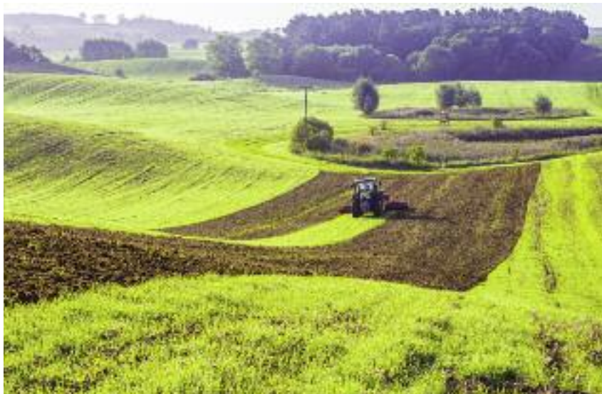
Najwięcej wniosków – 3,88 mln – złożono w ramach „Płatności ONW”

Dotychczas odbyły się dwa nabory wniosków o przyznanie pomocy: