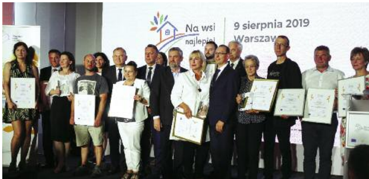
Minister rolnictwa i rozwoju wsi Jan Krzysztof Ardanowski z laureatami drugiej edycji konkursu „Na wsi najlepiej”

– To druga edycja projektu „Na wsi najlepiej – 12 dobrych praktyk w turystyce wiejskiej”. Ucieszyła nas bardzo duża liczba zgłoszeń. Otrzymaliśmy ich o 47 procent więcej niż w ubiegłym roku. Warto podkreślić jest także wysoki poziom kandydujących obiektów. To pokazu-