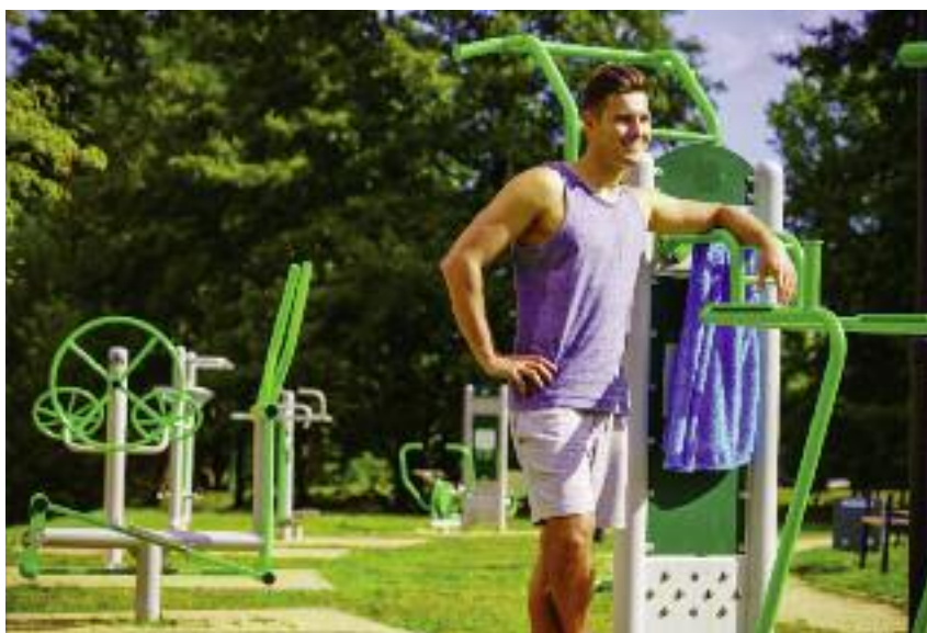
Dzięki wsparciu w ramach poddziałania „Wdrażanie lokalnych strategii rozwoju” wybudowano lub przebudowano 4,5 tys. ogólnodostępnej, niekomercyjnej infrastruktury rekreacyjnej, turystycznej i kulturalnej