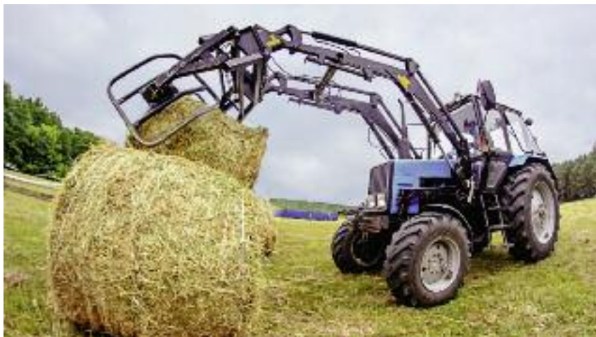
W ramach jedyne dotychczas naboru na działanie „Rozwój przedsiębiorczości – rozwój usług rolniczych” złożono blisko 1900 wniosków na kwotę 790 mln zł. W wyniku realizacji zatwierdzonych operacji zakupionych zostanie 5,3 tys. sztuk sprzętu ruchomego

Zgodnie z harmonogramem planowanych naborów wniosków w ramach PROW 2014-2020, najbliższy nabór na ww. działanie planowane jest we wrześniu 2019 r.