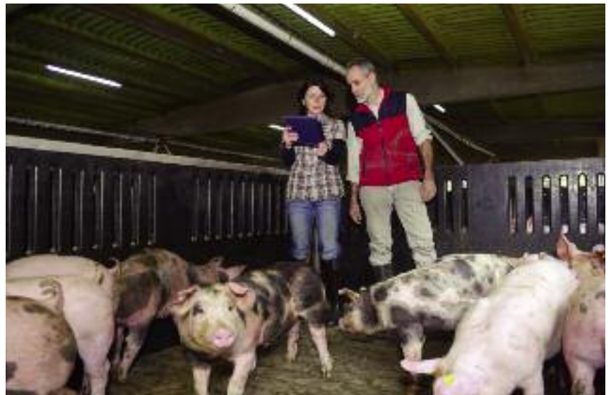
Jedną z podstawowych metod zabezpieczenia gospodarstwa przed ASF jest ścisłe przestrzeganie norm bioasekuracji

stru wejść osób do pomieszczeń, w których są utrzymywane świnię;