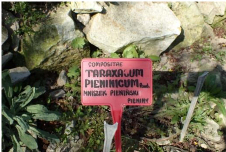
Fot. 12. Taraxacum pienanicum w Ogrodzie Botanicznym UMCS w Lublinie

Ogród Botaniczny Uniwersytetu im. M. Curie-Skłodowskiej w Lublinie: w 2017 w uprawie, wprowadzony w 2011-2012 - 15 młodych roślin z in vitro od dr hab. Aliny Trejgiell UMK w Toruniu (z nasion z Ogródu Botanicznego-CZRB PAN w Warszawie - nasiona z ogródka Pienńskiego PN), obecnie 2 sztuki; uprawa i mnożenie trudne, nasiona krótko zachowują zdolność do kiełkowania, rośliny chętnie zjadane przez ślimaki (inf. niepubl. uzyskane z ogrodu, 2017).