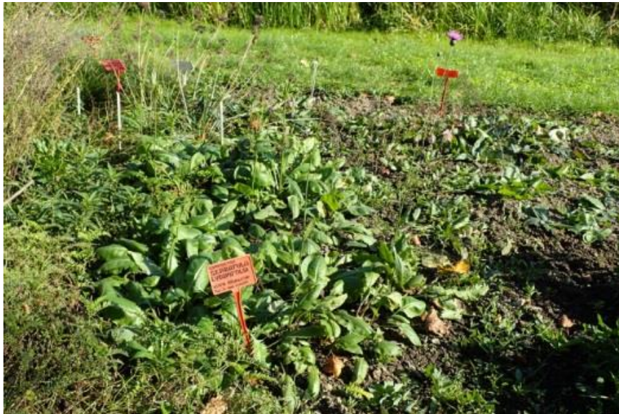
Fot. 11. Serratula lycopifolia w Ogrórze Botanicznym UMCS w Lublinie (fot. Krzysztof Ziarnek)

Ogród Botaniczny Uniwersytetu im. M. Curie-Skłodowskiej w Lublinie: w 2017 w uprawie, wprowadzony 24.05.2010 - 7 młodych roślin oraz 10.06.2015 - 5 młodych roślin z Ogródu Botanicznego-CZRB PAN w Warszawie (z Rezerwatu przyrody Skorocice, k. Buska), obecnie 12 sztuk; uprawa średnio trudna, nasiona zjadane przez bezkręgowce (inf. niepubl. uzyskane z ogrodu, 2017).