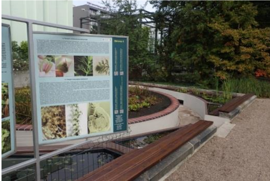
Fot. 1. Miejsce uprawy i tablica edukacyjna o Aldrovanda vesiculosa w Ogrodzie Botanicznym Uniwersytetu Wrocławskiego