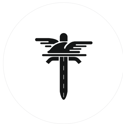
WERSJA ACHROMATYCZNA - NEGATYW