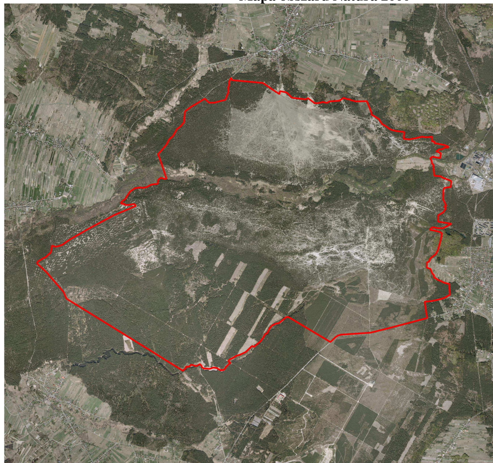
Mapa obszaru Natura 2000

Obszar Natura 2000 Pustynia Błędowska PLH120014