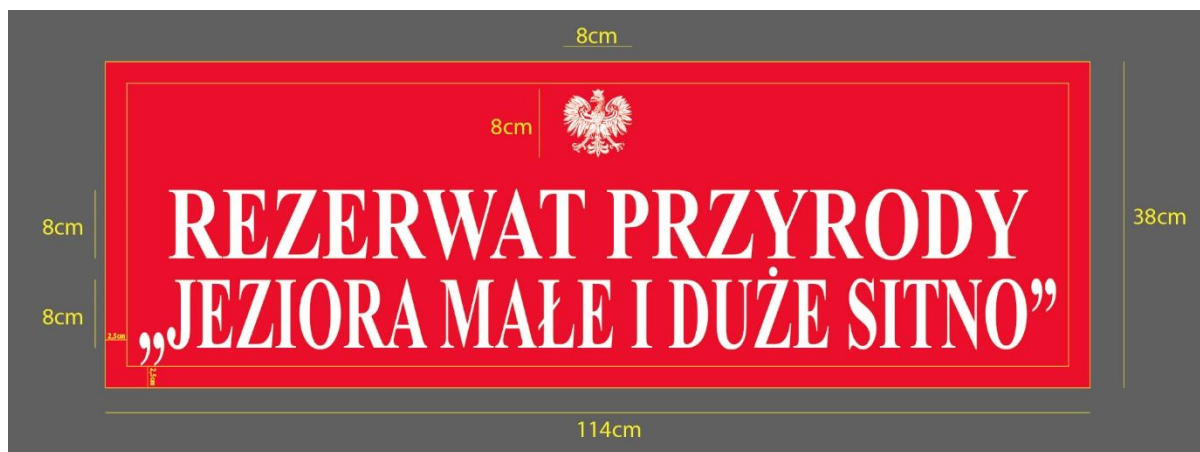
rysunek. 2: Przykład lica tablicy urzędowej

Wzory tablic informujących o nazwie form ochrony przyrody określa załączniki nr 1 do Rozporządzenia Ministra Środowiska z dnia 10 grudnia 2004 r. w sprawie wzorów tablic (Dz. U. z 2004 r. nr 268 poz. 2665).