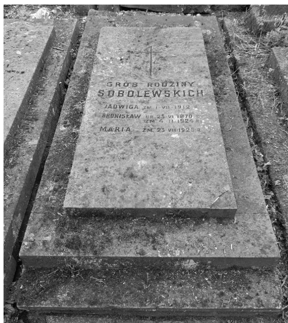
Miejsce pochówku Bronisława Sobolewskiego, fot. M. Wolff-Zdzienicki.

Bronisław Sobolewski zmarł 4 lutego 1924 r. w Warszawie na atak serca w czasie wygłaszania swojego wystąpienia na sali sądowej. Został pochowany na cmentarzu Powązkowskim, kwatery 169–6–10.