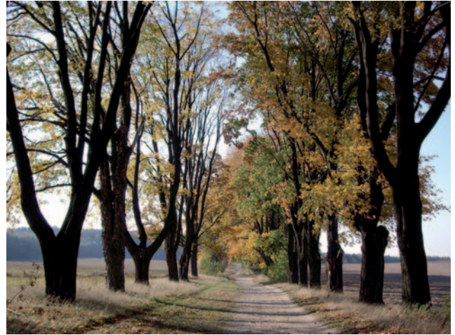
Fot. 7. Aleja klonowa w Złotym Potoku