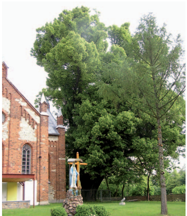
Fot. 3. Lipa drobnolistna w Cielętnikach - obwód 11 m

Jeleśnia, źródło „Pani Halskiej” w Sokolnikach, gmina Niegowa, źródło „Spod brzozy” w Żarkach.