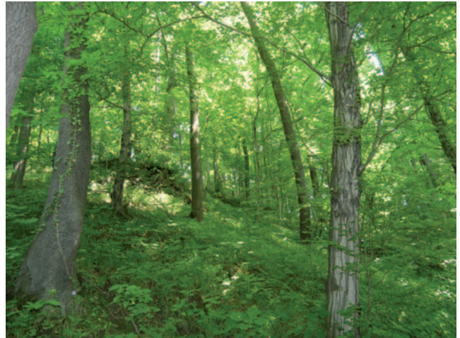
Fot. 1. Rezerwat przyrody „Grapa”

Ze względu na przedmiot ochrony utworzono w województwie śląskim rezerваты faunistyczne, krajobrazowe, leśne, torfowiskowe, florystyczne, wodne i przyrody nieożywionej. Najwięcej jest rezerwatów leśnych np. „Barania Góra”, „Las Murckowski” „Cisy w Hucie Starej”, „Sokole Góry”, „Bukowa Góra”. Do naj-