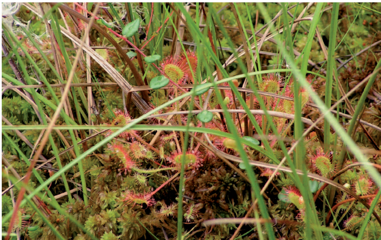
Fot. 5. Rosiczka okrągłolistna na użytku ekologicznym w Herbach – roślina charakterystyczna dla zbiorowisk torfowiskowych