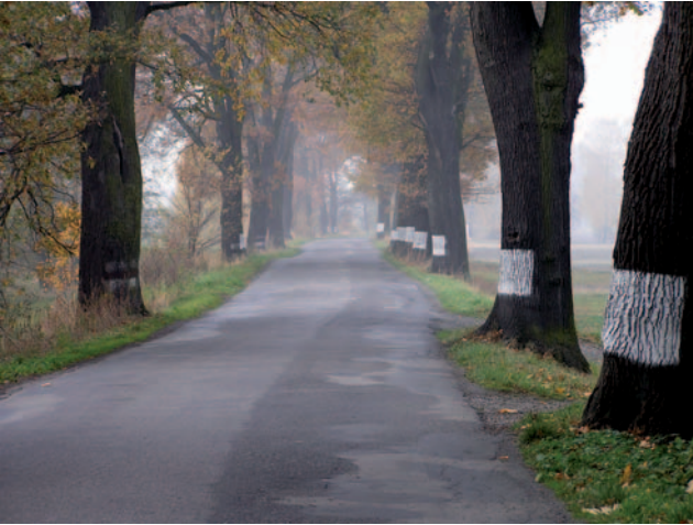
Fot. 6. Aleja dębowa w Chybiu