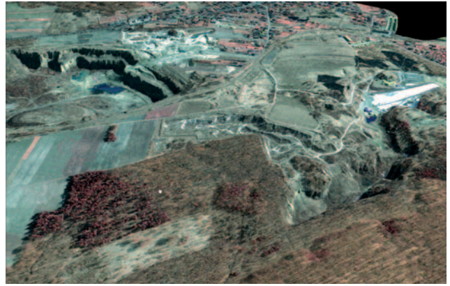
Fot. 2. Dolomity w Bytomiu - na pierwszym planie stanowisko dokumentacyjne „Błachówka” na terenie Obszaru Natura 2000 Podziemia Tarnogórsko-Bytomskie – widoczne oba wyrobiska dolomitów w okolicy wlotów do korytarzy (projekcja 3D satelita IKONOS)

Prace WZS województwa śląskiego wykazały rejon istotne dla występowania siedlisk i gatunków wymienionych w Załączniku I i II Dyrektywy Siedliskowej. Zasadność włączenia omawianych obszarów do sieci „NATURA 2000” oraz proponowany przebieg granic będzie przedmiotem weryfikacji przeprowadzanej na szczeblu krajowym przez Instytut Ochrony Przyrody PAN w Krakowie w uzgodnieniu z Generalną Dyrekcją Ochrony Środowiska. Ostateczna decyzja o wyznaczeniu ww. ostoi, w tym ustalenie przebiegu jej granic, zostanie podjęta w oparciu o wyniki ww. weryfikacji.