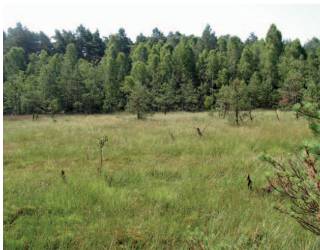
Fot. 4. Użytek ekologiczny Bagno koło Mikołeski

Użytki ekologiczne tworzy się w celu ochrony obszarów pełniących funkcję ekologiczną dla zachowania różnorodności biologicznej. Mogą to być np. bagna, starorzecza, śródleśne oczka wodne, wydmy, zadrzewienia śródpolne, zabytkowe parki, stanowiska chronionych gatunków roślin i zwierząt. W województwie śląskim utworzono 71 użytków ekologicznych, np. ekosystemy hydrogeniczne „Starorzecze przy kościele w Rudach”, gmina Kuźnia Raciborska; torfowisko Dubiele w Koszęcinie; ujście cieku wodnego „Żabiniec” w Bielsku-Białej; „Las na Górze Hugona” w Świętochłowicach; eutroficzna młaka górska „Hala Cebulowa” w Sopotni Wielkiej, gmina Jeleśnia; bagno „Misiowa” w Koniecpolu; „Śródleśne łąki w Starych Maczkach” w Sosnowcu; skały krasowe „Góry Towarne”, gmina Olsztyn.