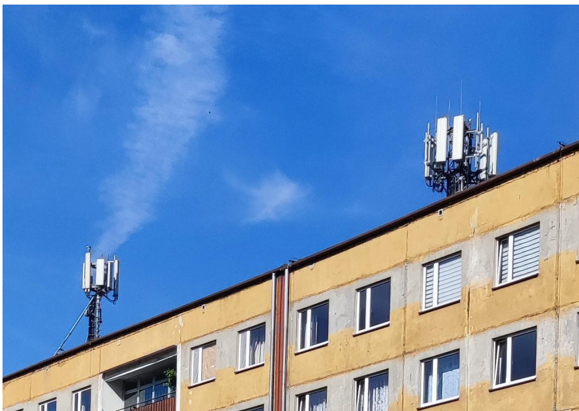
Fot. 1: Widoki anten stacji bazowych: ID: 2613, ID: BT22133, zlokalizowanych: ul. Paderewskiej 32, Katowice