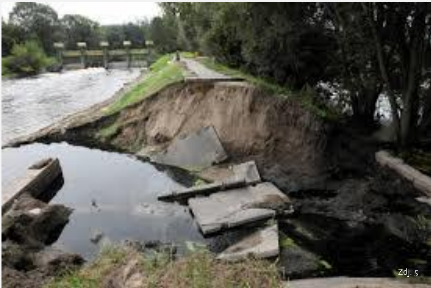
Zniszczony wał przeciwpowodziowy