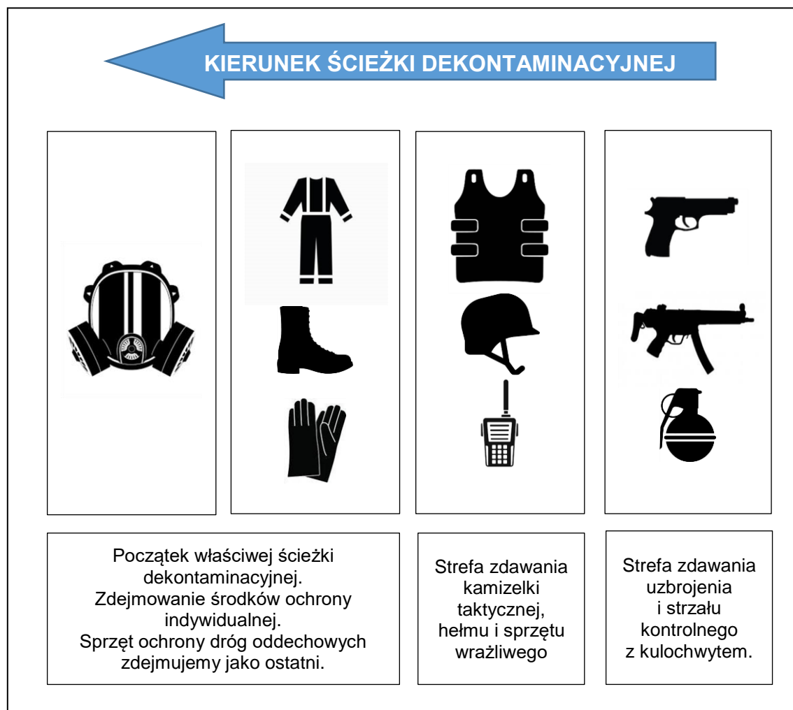
Rys. 1. Schemat kierunku ścieżki dekontaminacyjnej funkcjonariuszy formacji uzbrojonych.

Realizacja zadań podczas prowadzenia dekontaminacji uzbrojonych funkcjonariuszy odbywa się na zasadach opisanych w załączniku nr 3 z tą różnicą, że wejście na ścieżkę dekontaminacyjną należy poprzedzić strefą zdejmowania i zabezpieczenia uzbrojenia.