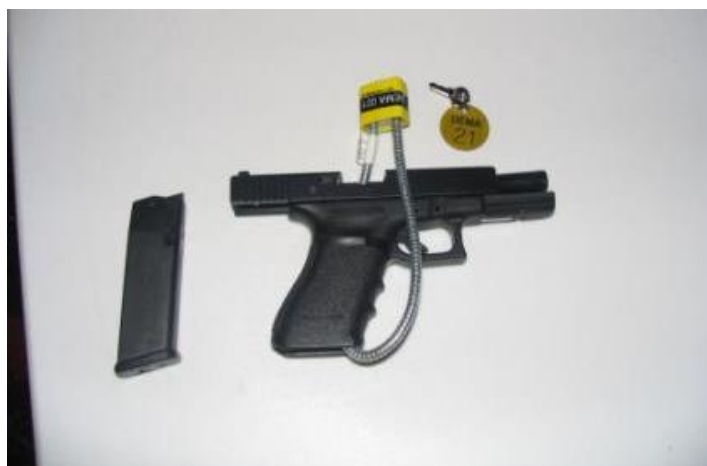
Fot. 4. Przykład zabezpieczonej broni.

Posiadacze legalnej broni palnej, a w szczególności funkcjonariusze służb uzbrojonych, zobowiązani są, aby broń palna i amunicja nie dostała się w ręce osób nieuprawnionych. Niektóre formacje uzbrojone do celów zabezpieczenia broni poddawanej procesowi dekontaminacji stosują zamykane na klucz zabezpieczenia.