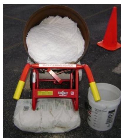
Fot. 2. Improwizowany kulochwyt.