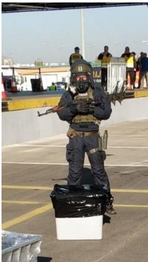
Fot. 6. Zabezpieczenie skontaminowanej broni palnej podczas dekontaminacji funkcjonariuszy służb uzbrojonych.

Broń umieszczona w skrzyni transportowej lub szczelnym bębnie zostaje zapakowana i zabezpieczona przez wyznaczonego funkcjonariusza.