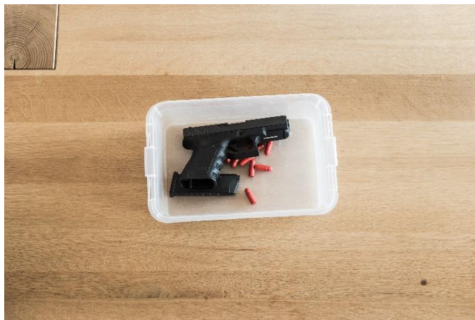
Fot. 3. Przykładowe rozładowanie broni palnej.

Pierwszym etapem dekontaminacji funkcjonariusza jest rozładowanie broni, oddanie strzału kontrolnego i potwierdzenie, że podejmowane czynności dekontaminacyjne będą bezpieczne. Funkcjonariusz rozładowując broń palną powinien umieścić wszystkie jej elementy w wyznaczonym pojemniku, tj.: broń palną, magazynek, amunicję z magazynku oraz z komory nabojojowej.