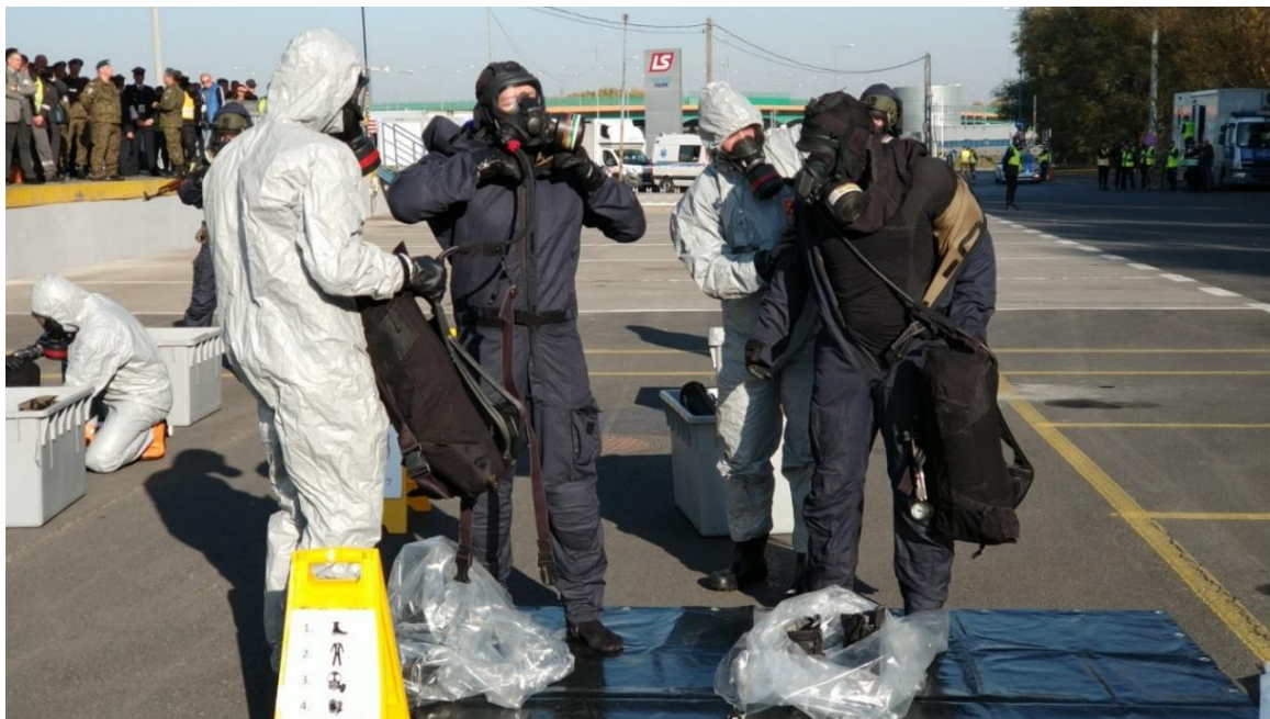
Fot. 5. Zdejmowanie wyposażenia osobistego funkcjonariuszy służb uzbrojonych w trakcie dekontaminacji.

Po usunięciu oprządzenia funkcjonariusz przechodzi na właściwą ścieżkę dekontaminacyjną.