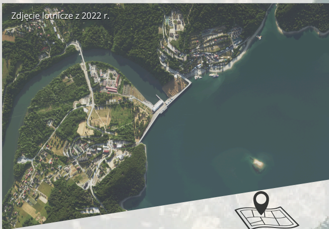
Zdjęcie lotnicze z 2022 r.

Jezioro Solińskie znajduje się w Bieszczadach, w powiecie leskim, w województwie podkarpackim. Najbardziej popularne i znane miejscowości położone nad Jeziorem Solińskim to Solina, Polańczyk czy Wołkowyja.