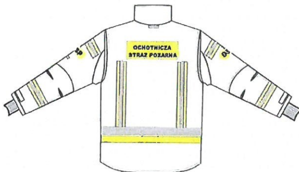
Przykładowy widok kurtki