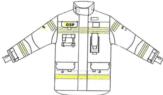
Przykładowy widok kurtki